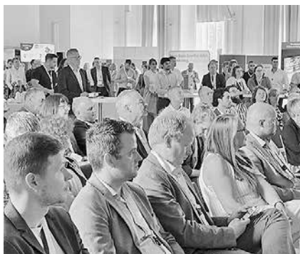
Neben spannenden Vorträgen stellten sich auch verschiedene Unternehmen vor.

In den Vorträgen und Themenräumen standen aktuelle Zukunftsfragen des Mittelstands im Fokus. Die Beiträge reichten