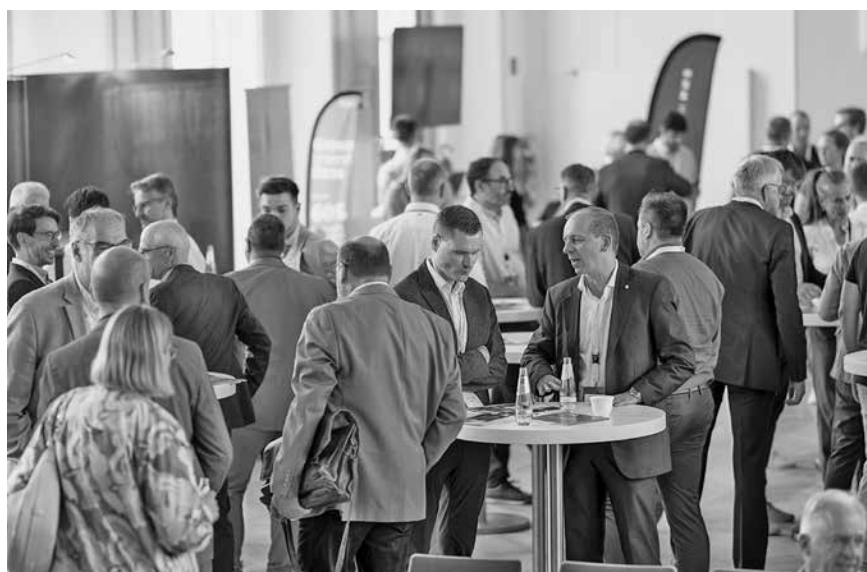
Zahlreiche Vertreter aus der Wirtschaft der Wartburgregion kamen im Kulturhaus Geisa zusammen für neue Impulse.

von Cybersicherheit und digitaler Souveränität über Automatisierung und Künstliche Intelligenz bis hin zu nachhaltiger Industrieentwicklung, Organisationswandel und Fachkräfteintegration. Damit griff der Unternehmertag zentrale Herausforderungen auf, die viele Unternehmen in der Wartburgregion derzeit bewegen.