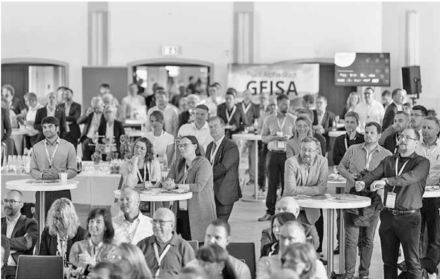
Unternehmertag „Wartburg vernetzt“ 2026 in Geisa