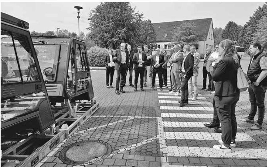
Besichtigung der Fahrzeugbau GmbH Geisa