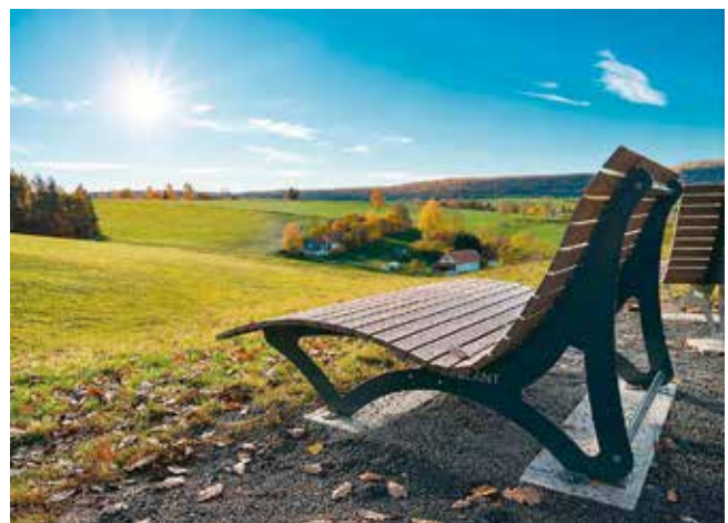
Waldsofa am Pirschpfad bei Gerterode