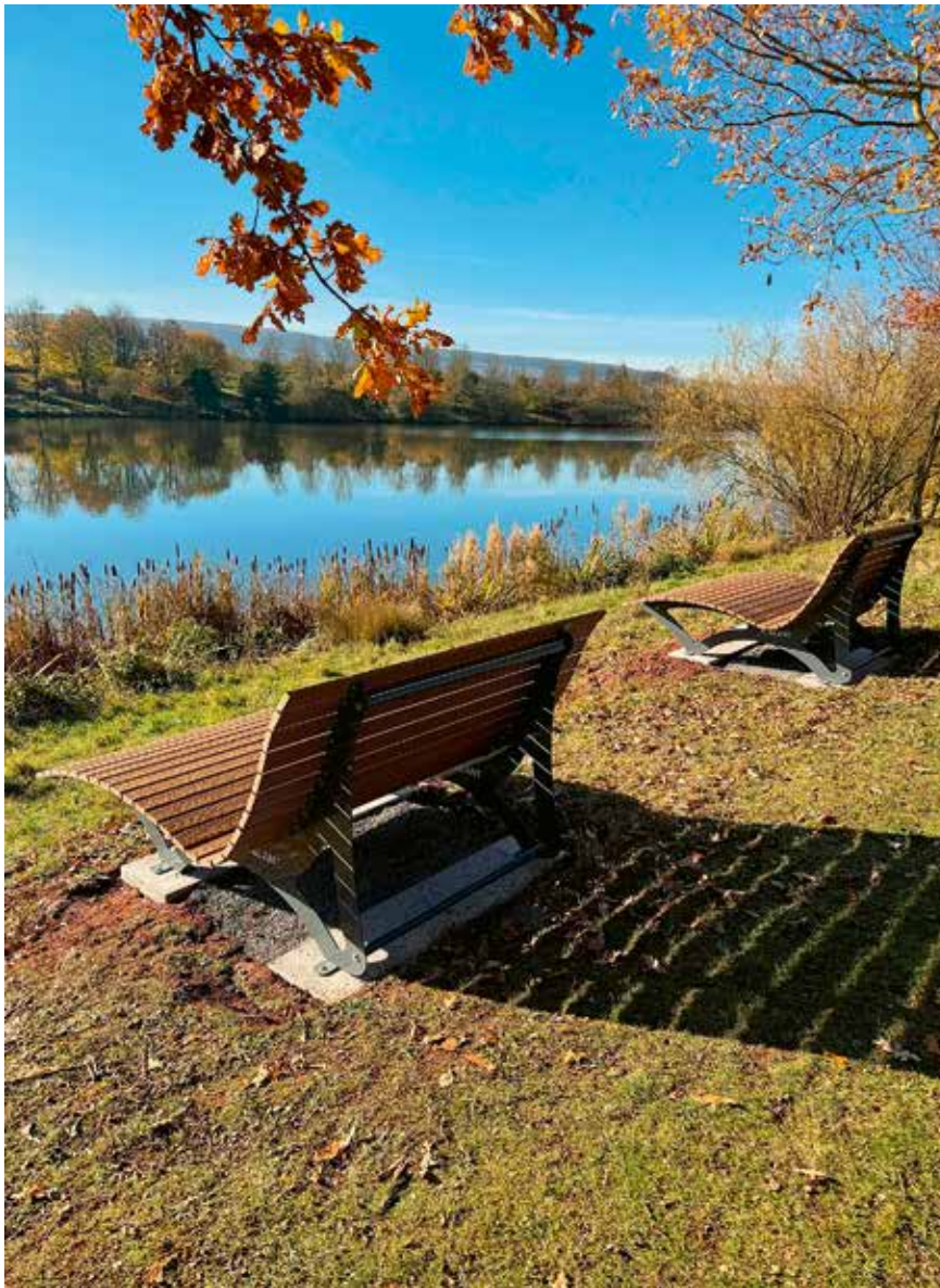
Waldsofas am Ahlenbachstausee