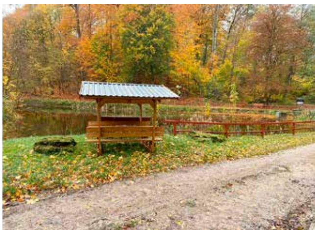
Waldschänke am Wildunger Teich