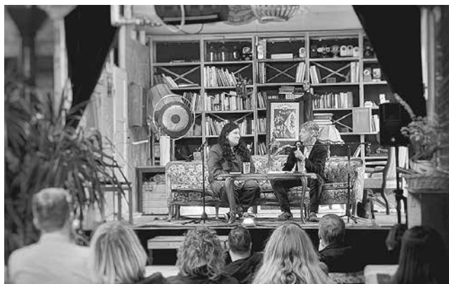
Willkommensveranstaltung der Stadtschreiberin am 7. April 2026