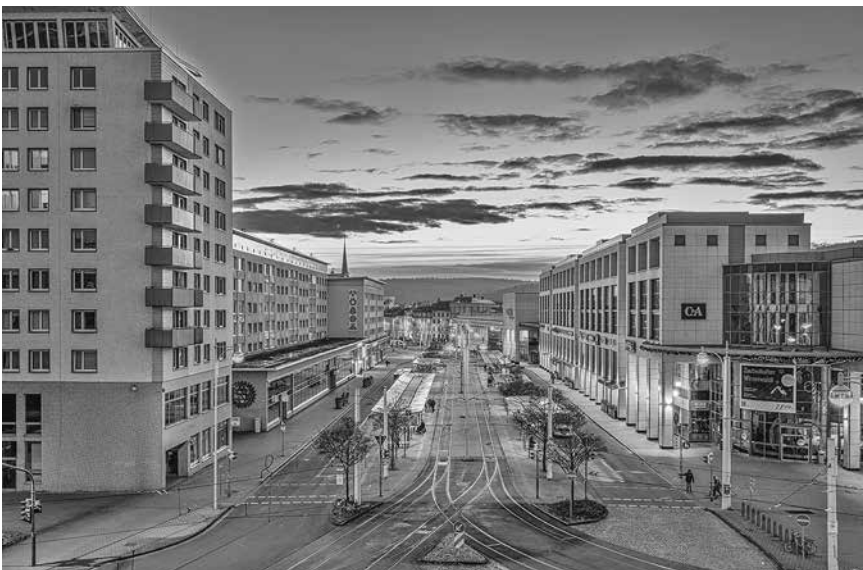
Geras Heinrichstraße als zentrale Umsteigestelle und Mittelpunkt der Innenstadt.