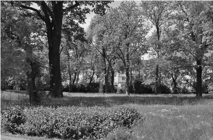
Blick in den Park der Jugend.