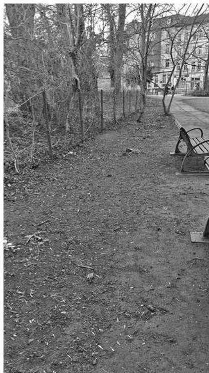
Entfernung Sträucher zur Verbesserung von Sichtachsen und Entgegenwirken von Angsträumen und Unrat im Park der Jugend.

Die AG Urbane Sicherheit prüft seit Anfang des Jahres die Einführung der „Safe Now“-App. Diese ist eine benutzerfreundliche Sicherheitsanwendung, die in Notfallsituationen schnelle Hilfe ermöglicht. Mit einem Klick können Not-