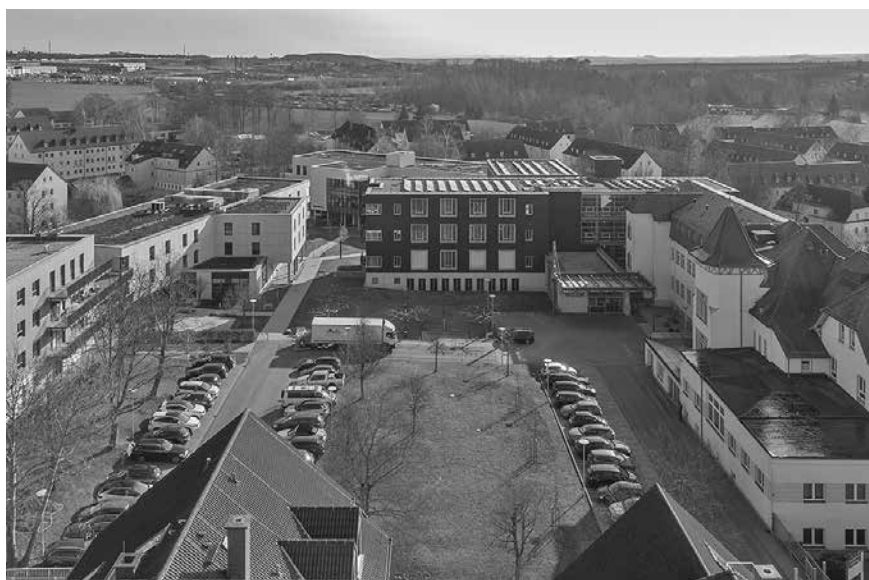
Blick auf den Medizincampus Ronneburg. Der Krankenhaus-Standort vereint die Fachklinik für Geriatrie, Reha-Klinik und Pflegeheim.