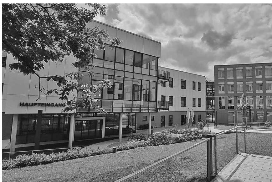
Der Haupteingang zum Krankenhaus Ronneburg.