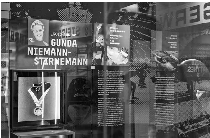
Eisschnelllauf, Radsport, Schwimmen, Basketball und viele weitere Sportarten mit ihren Athletinnen und Athleten werden präsentiert. © Stadtverwaltung Erfurt