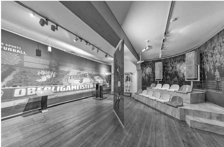
Der FC Rot-Weiß Erfurt feiert 2026 seinen 60. Geburtstag. Dem Verein ist ein eigener Bereich in der Ausstellung gewidmet.