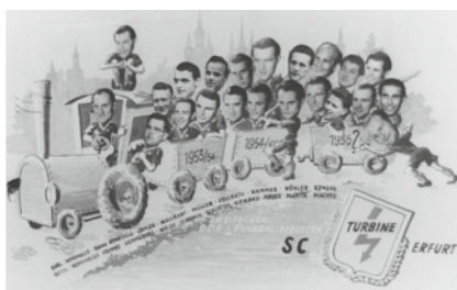
Die legendäre Meistermannschaft des SC Turbine Erfurt von 1953 bis 1955

Auch das Schwimmen gehört zu den Traditionssportarten. Jutta Langenau holte 1954 als Europameisterin den ersten internationalen Titel für die DDR. Fortan riss die Kette erfolgreicher Schwimmer um Olympiasieger Roland Matthes nicht mehr ab.