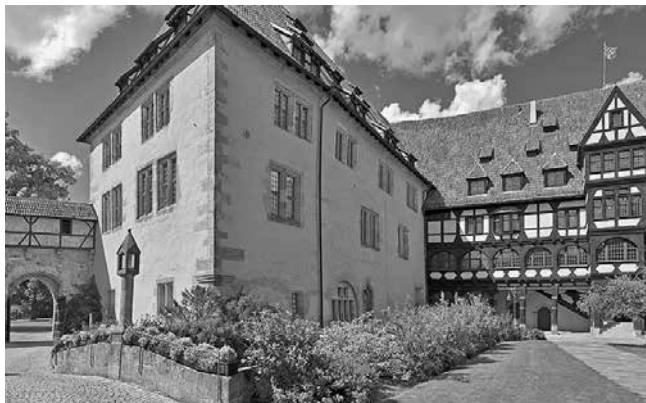
Veste Coburg

Mit den unmittelbaren Folgen von 1547 war aber in Sachen Verkleinerung nur der Anfang gemacht. Es folgten mehrere Erbteilungen und nochmalige Teilungen bereits geteilter Gebiete. Zwar gab es immer wieder den Versuch, die Nachkommen zur gemeinsamen Herrschaftsausübung zu verpflichten, das gelang jedoch nur selten oder vorübergehend. Grundprinzip der gleichberechtigten Teilungen war es, alle Erbberechtigten mit Einkünften in gleicher Höhe zu versorgen. Die Einkünfte kamen aus den Ämtern, den kleinsten Verwaltungseinheiten der Herrschaftsgebiete. Diese wurden bei den Teilungen nach Wirtschaftskraft bewertet und zu etwa gleichen Summen