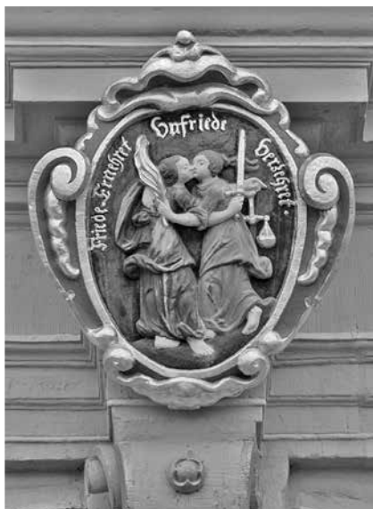
Ausdruck von Einigkeitsstreben: der Friedenskuss am Nordportal von Schloss Friedenstein

Die Ernestiner als eine der beiden Hauptlinien des Hauses Wettin regierten weite Teile des heutigen Freistaats Thüringen seit der Teilung in die ernestinische und die albertinische Linie 1485. Zunächst waren die thüringischen Territorien nur ein Teil ihres Herrschaftsgebiets. Nach der Niederlage im Schmalkaldischen Krieg gegen den katholischen Kaiser 1547 verloren die protestantischen Ernestiner die Kurwürde an die Albertiner und waren im Wesentlichen auf Thüringen zurückgedrängt.