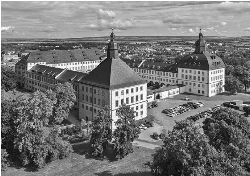
Schloss Friedenstein Gotha