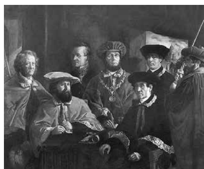
Gemeinsame ernestinische Universität: Jubiläumsbild der Universität Jena 1858

Zwar verloren diese Herrschaftsgebiete im Lauf des 19. Jahrhunderts zunehmend an politischer Eigenständigkeit, umso stärker pflegten sie aber ihre eigene Kulturpolitik, die sich in Bau- und Gartenkunst, Theatern und Mäzenatentum niederschlug. Bei allen Teilungen und Neugliederungen ging