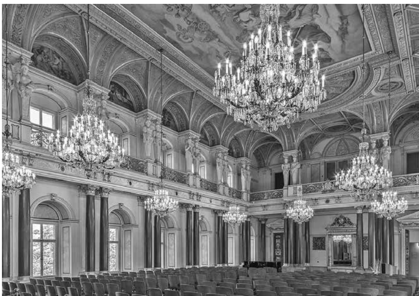
Festsaal im Residenzschloss Altenburg