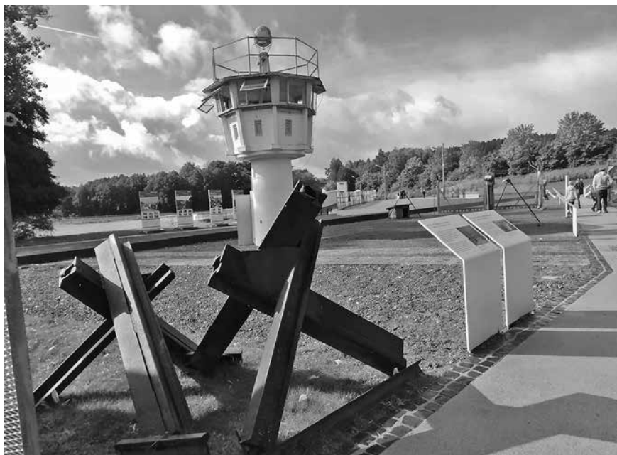
Außengelände Grenzmuseum Mödlareuth