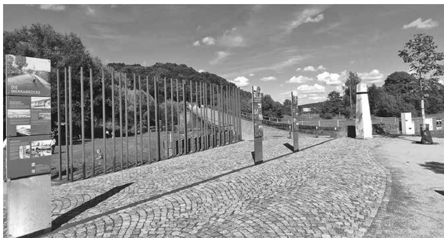
Grenzgedächtnispark Brücke Vacha

Autorin: Heidi Brandt | Landratsamt Wartburgkreis | Projektkoordinierung „Iron Curtain Trail entlang der Thüringer Landesgrenze“