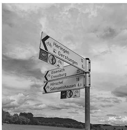
ICT-Beschilderung bei Gerstungen

Jedem dieser Themenabschnitte werden Grenzgedenkstätten, Grenztürme, Grenzüber-