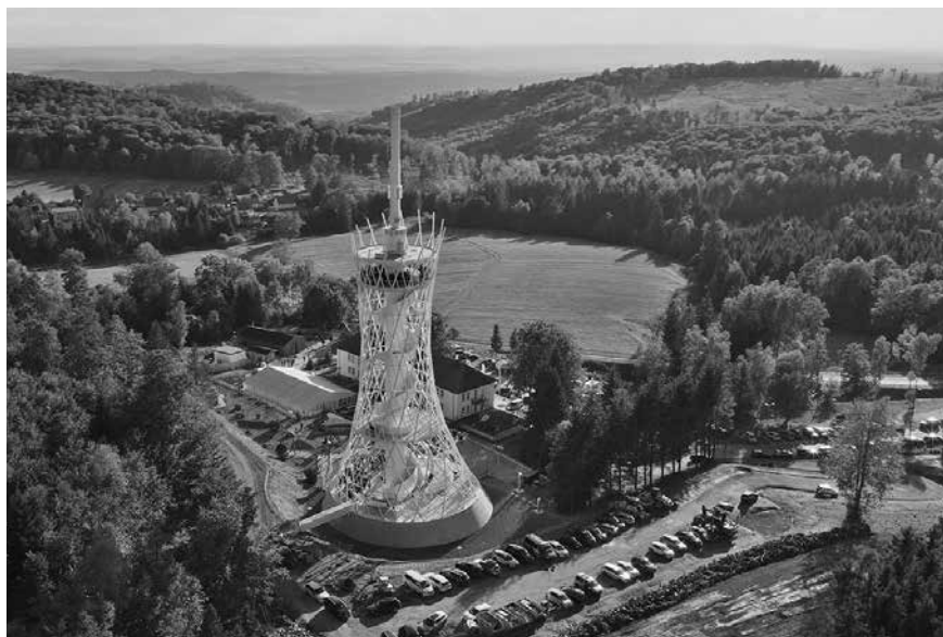
HEX Erlebniswelt im Harzer Bergdorf Rothesütte