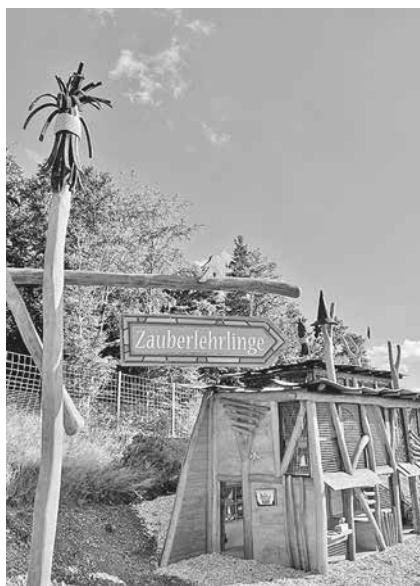
Spielwelt für Hexen und Zauberlehrlinge