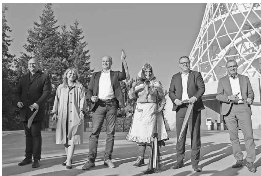
Feierliche Eröffnung mit Ministerpräsident Mario Voigt