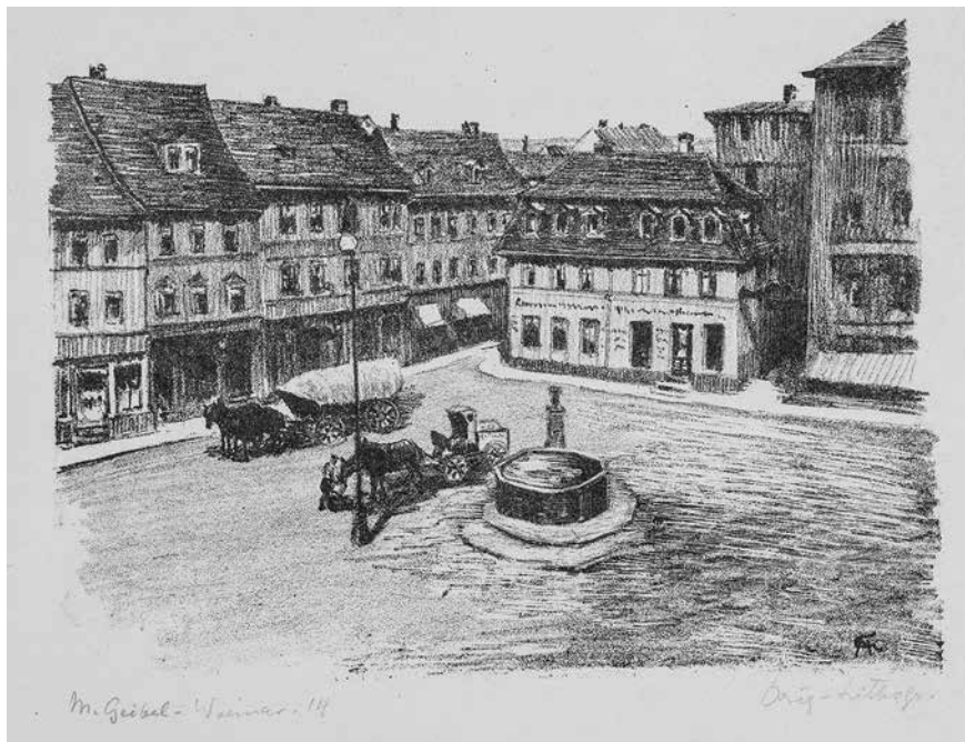
Margarethe Geibel: Frauenplan mit Goethebrunnen, Lithographie, entstanden 1914