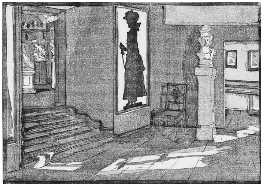
Margarethe Geibel: Das Silhouetten- bzw. Gartenzimmer im Weimarer Goethehaus, Farbholzschnitt aus dem „Goethehaus-Zyklus“, entstanden 1908