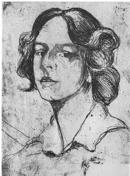
Margarethe Geibel: Selbstporträt, Radierung 1905

Um 1907 gelang ihr der Durchbruch. Auf den graphischen Ausstellungen des Deutschen Künstlerbundes wurde sie neben Künstlern wie Max Klinger oder Käthe Kollwitz gezeigt. Kritiker lobten die „kühne Farbwirkung“ ihrer Blätter und ihre technische Meisterschaft. Doch was Margarethe Geibel wirklich unverwechselbar machte, war die Verbindung von Modernität und Genauigkeit: Sie arbeitete mit flächigen, harmonisch abgestimmten Farbzonen, verzichtete auf illusionistische Modellierung – und erzielte dennoch eine eindrucksvolle räumliche Wirkung.