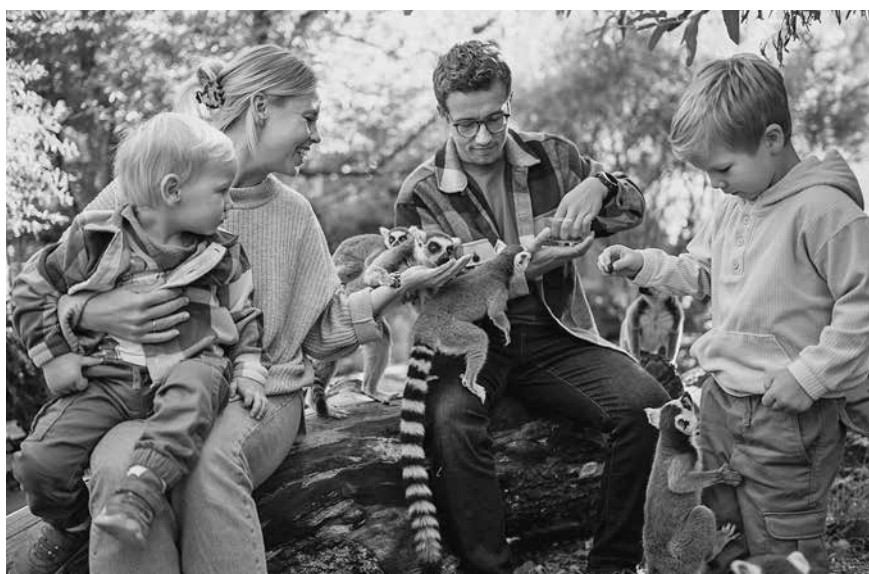
Einen exklusiven Einblick hinter die Kulissen bietet das zoopädagogische Angebot „Dein Tiererlebnis“.