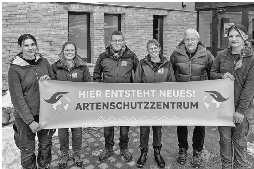
Der Zoopark ist ein außerschulischer Lernort: Im Artenschutzzentrum entsteht eine Ausstellung zum Lebensraum „Wald“. Bedrohte Tierarten aus verschiedenen Wäldern dieser Welt werden thematisiert.