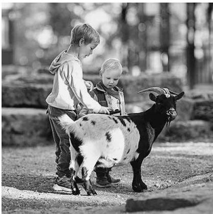
Ganz nah dran: Im Streichelgehege können Kinder Westafrikanische Zwergziegen striegeln.