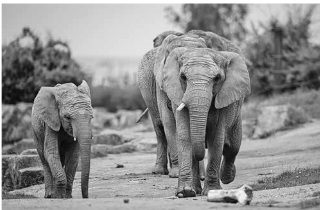
Durch die großzügig gestalteten Tieranlagen und qualifizierten Mitarbeiterinnen und Mitarbeitern wird der Zoopark zu einem Ort, an dem Naturerleben, Bildung und Nachhaltigkeit aufeinandertreffen.

Autorin: Anne Protzel, Thüringer Zoopark Erfurt