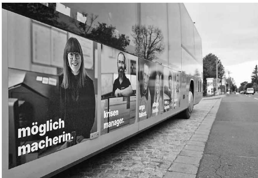
Dieser Bus ist ein echter Hingucker. Seit Ende September ist er im Landkreis unterwegs.