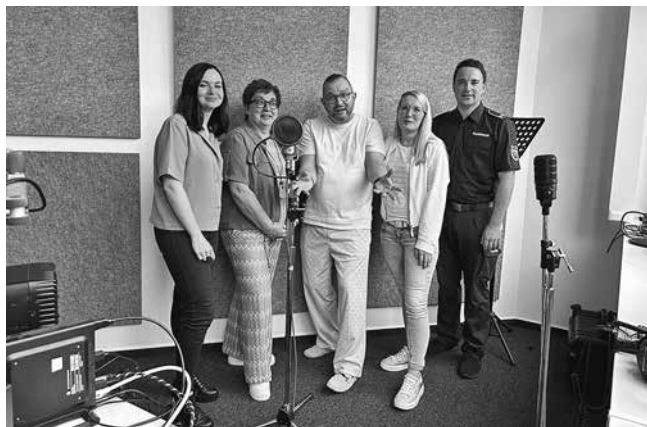
Im Radiostudio am Mikrophon zu stehen, war für die Kolleginnen und Kollegen eine ganz neue Erfahrung