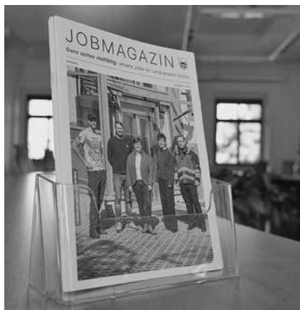
Auch im Jobmagazin zeigen viele Kolleginnen und Kollegen Gesicht. Zum Magazin gehört auch ein Imagefilm, der unter landkreis-gotha.de/karriere zu sehen ist.

motiviertes Personal, von dem wir auch schon eine ganze Menge haben.“ Aufgrund von Renteneintritten, der Weiterentwicklung der Verwaltung und persönlichen Veränderungswünschen gibt es dennoch regelmäßig Stellen zu besetzen.