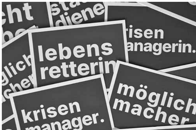
Mit diesen Postkarten wird für Ausbildung und Studium im Landratsamt geworben