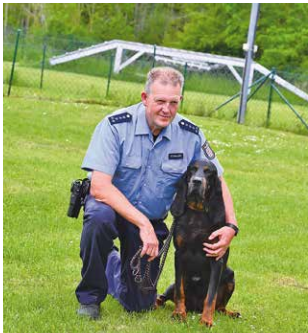
Coonhound Burnie hat als Personenspürhund schon ein vermisstes Kind gefunden und den Mord einer Rentnerin aus Artern aufgeklärt