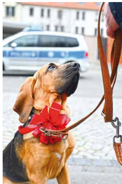
Frieda will später Mantrailer werden. Es wird vermu- tet, dass das Riechhirn des Bloodhound leistungs- fähiger ist als bei anderen Hunderassen. Der Freistaat Thüringen bildet seit 2004 Personenspürhunde aus.