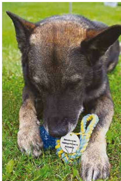
Gute Nachrichten für die vierbeinigen Einsatz- kräfte der Thüringer Polizei: Endlich dürfen sie nach ihrem Dienst ohne Schwierigkeiten bei Herrchen oder Frauchen bleiben.