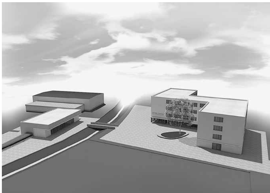
Vogelperspektive Gymnasium Bad Frankenhausen

Nach einem langwierigen und intensiven Abwägungsprozess entschied man sich für einen Ersatzneubau an der bereits vorhandenen Zweifeldhalle. Mit einem Investitionsvolumen von 12,5 Millionen Euro, wobei 4 Millionen Euro Fördermittel auf das Bundesministerium für Umwelt, Naturschutz, Bau und Reaktorsicherheit entfallen, entstehen dort modernste Lehr- und