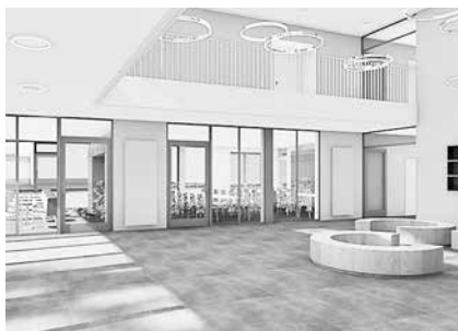
Geplantes Foyer Gymnasium Bad Frankenhausen