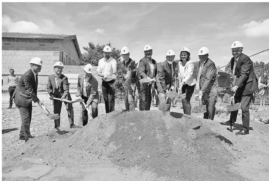
Spatenstich Regelschule Franzberg

Lernbedingungen, um künftig ca. 600 Schülerinnen und Schülern optimale äußere Rahmenbedingungen in 23 Klassen- und Kursräumen und 12 Fachunterrichtsräumen für ihren schulischen Werdegang zu bieten.