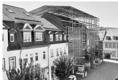
Das Objekt Markt 20 als eines der historisch bedeutsamsten Gebäude von Königsee wurde 2015/16 konstruktiv gesichert. Hier befand sich ab 1668 der Sitz des Amtes Schwarzburg. Seit 1879 bis 1951 war darin das Amtsgericht angesiedelt. Im Großen Saal im Obergeschoss befindet sich eine wertvolle Stuckdecke, die mit Denkmalmitteln gesichert wurde.

Ein Großteil der Investitionen kommt dem regionalen Handwerk und dem örtlichen Mittelstand zugute, schafft bzw. sichert damit Arbeitsplätze und trägt maßgeblich zur Aufwertung der Lebensqualität in der Stadt bei.