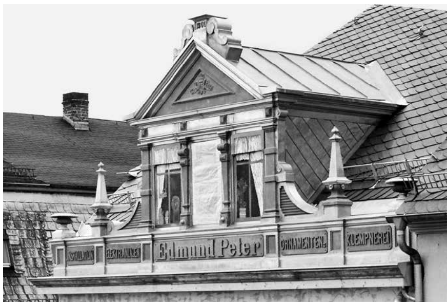
Das ortsbildprägende Wohn- und Geschäftshaus Schwarzburger Str. 2 als eines der wertvollsten Gebäude im zentralen Altstadtensemble wurde 2010/2011 konstruktiv gesichert. Die handwerklich seltene und interessante Zierblechbekrönung im Dachbereich wurde im Zuge der Sicherung restauriert und zum Teil erneuert.