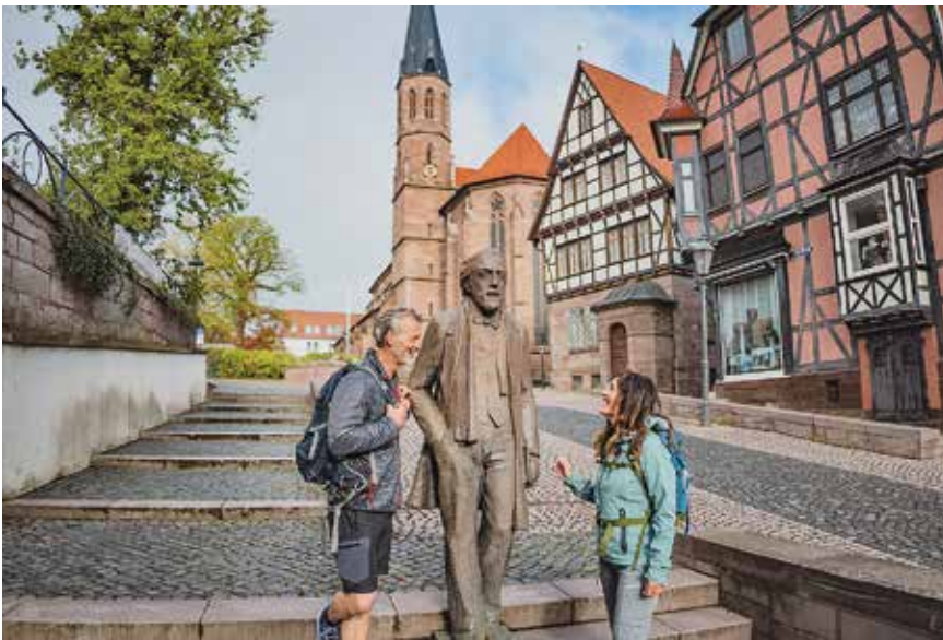
Theodor-Storm-Figur in Heilbad Heiligenstadt