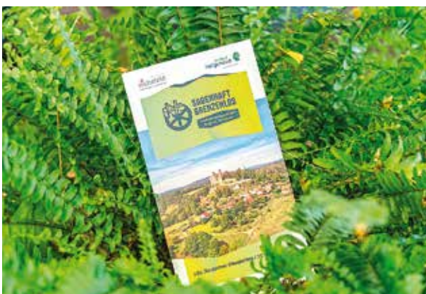
Programmheft zum 122. Deutschen Wandertag 2024