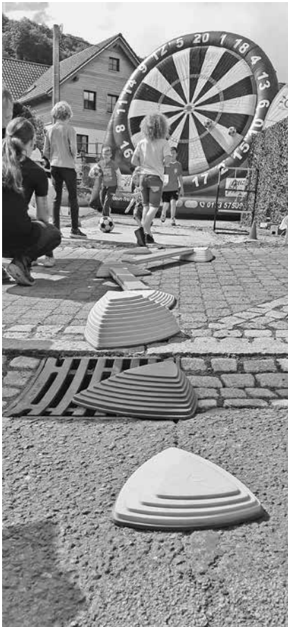
Die Kleinen hatten ihre Freude zum Landkreisfest