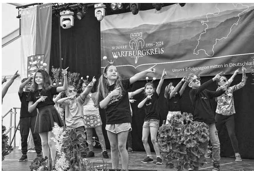
Bühne im Festzelt bot vielseitiges Programm aus Chor, Tanz und Folklore