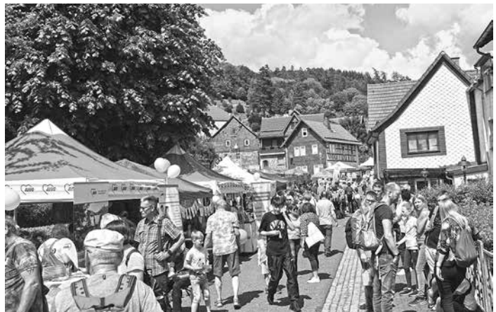
Zahlreiche Gäste strömten über die Festmeile