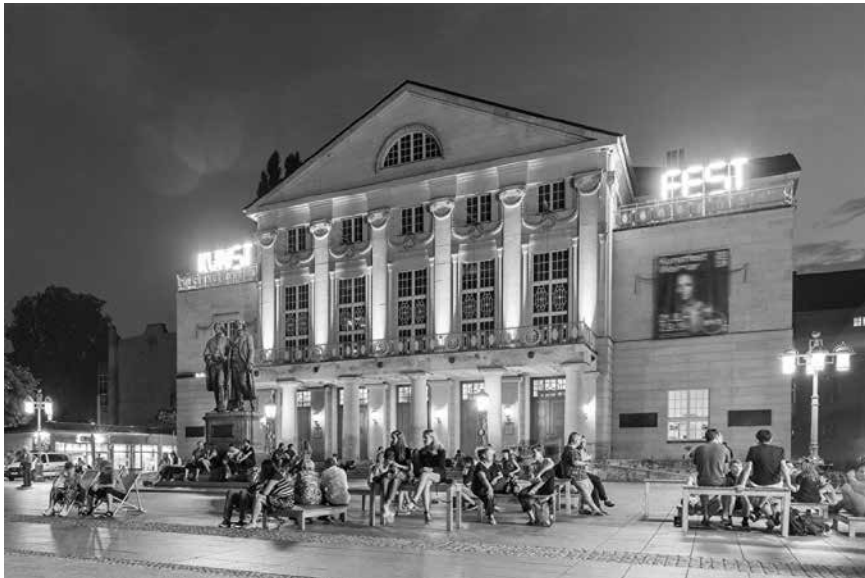
Große Kunst trifft auf leichte Muse im Weimarer Sommer.