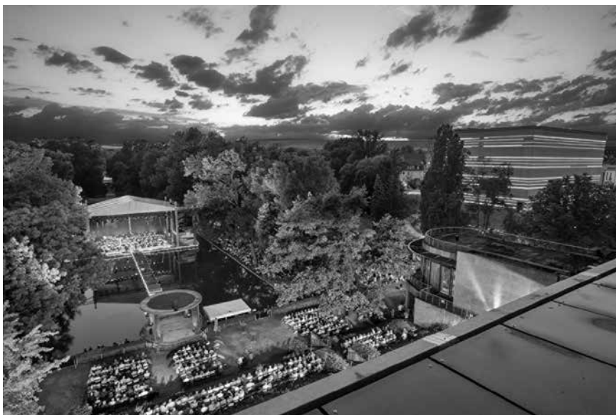
Auf der Seebühne im Weimarhallenpark finden im Weimarer Sommer vier große Konzerte statt.