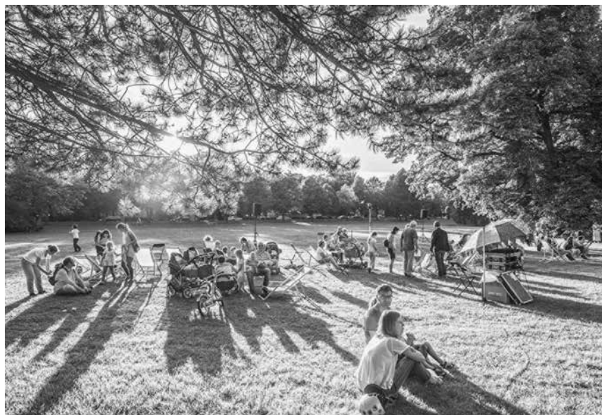
Gehören zum Erlebnis Sommer dazu und werden selbst zur Bühne: Weimars Parks und Gärten.

Zeitgenössische Kunst, wie sie das Kunstfest Weimar in die Stadt holt, findet hier einen Schmelztiegel aus vielen Bezügen