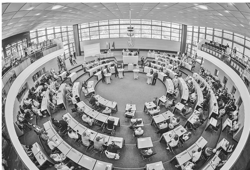
Im Plenarsaal befragen Bürgerinnen und Bürger die Abgeordneten in einer Podiumsrunde