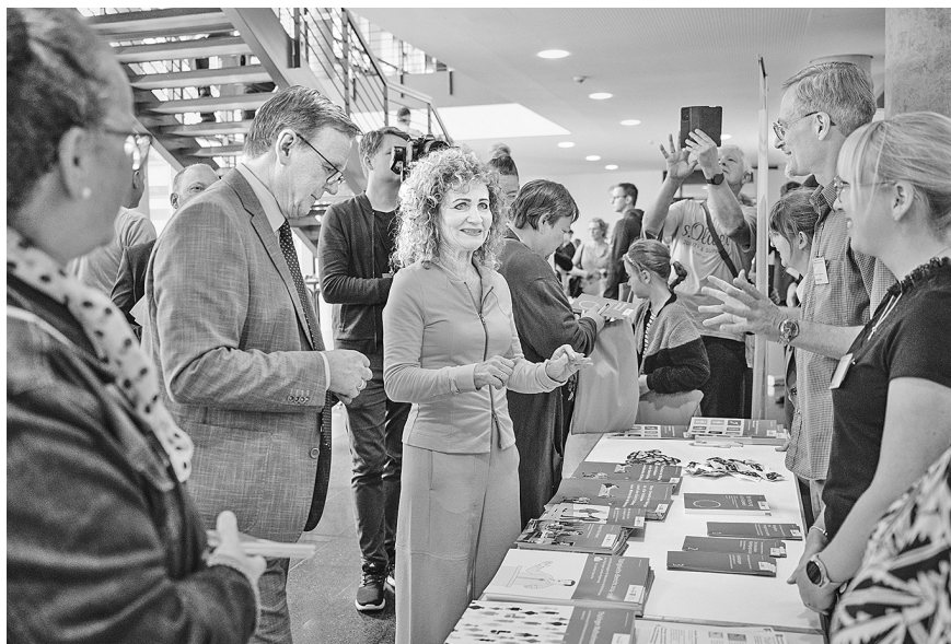
Landtagspräsidentin Birgit Pommer und Ministerpräsident Bodo Ramelow beim Tag der offenen Tür