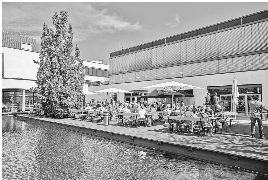
Der Innenhof lädt zum Verweilen ein

Ort: Thüringer Landtag Zeit: 1. Juni 2024, 10 – 17 Uhr