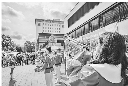
Auch musikalisch ist für alle etwas dabei, vom DJ bis zum Fanfarenzug