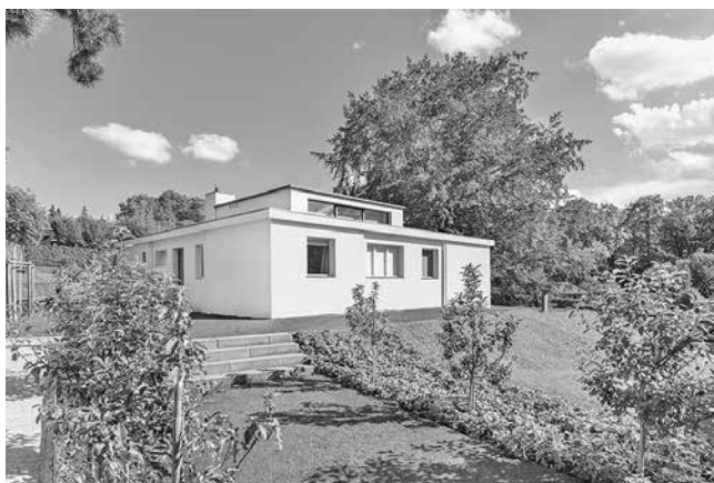
Das Haus Am Horn wurde in nur vier Monaten errichtet und gilt als Prototyp des neuen Bauens