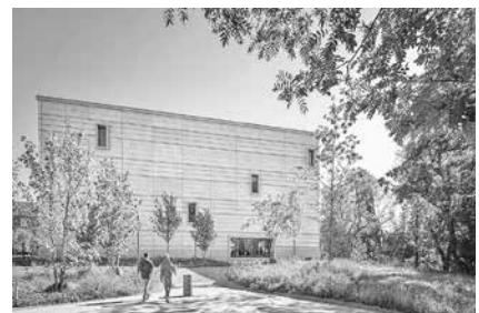
Das Bauhaus-Museum wurde 2019 eröffnet

Auch die heutigen Studierenden der Bauhaus-Universität Weimar tragen aktiv zum Jubiläumsprogramm bei. Im Schiller-Museum