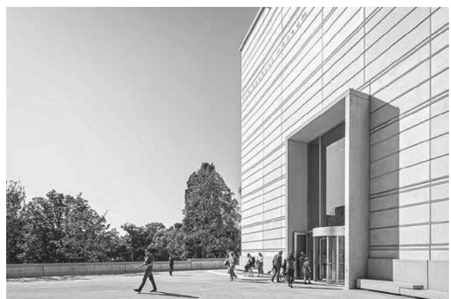
Das Bauhaus-Museum Weimar beherbergt die weltweit älteste Bauhaus-Sammlung