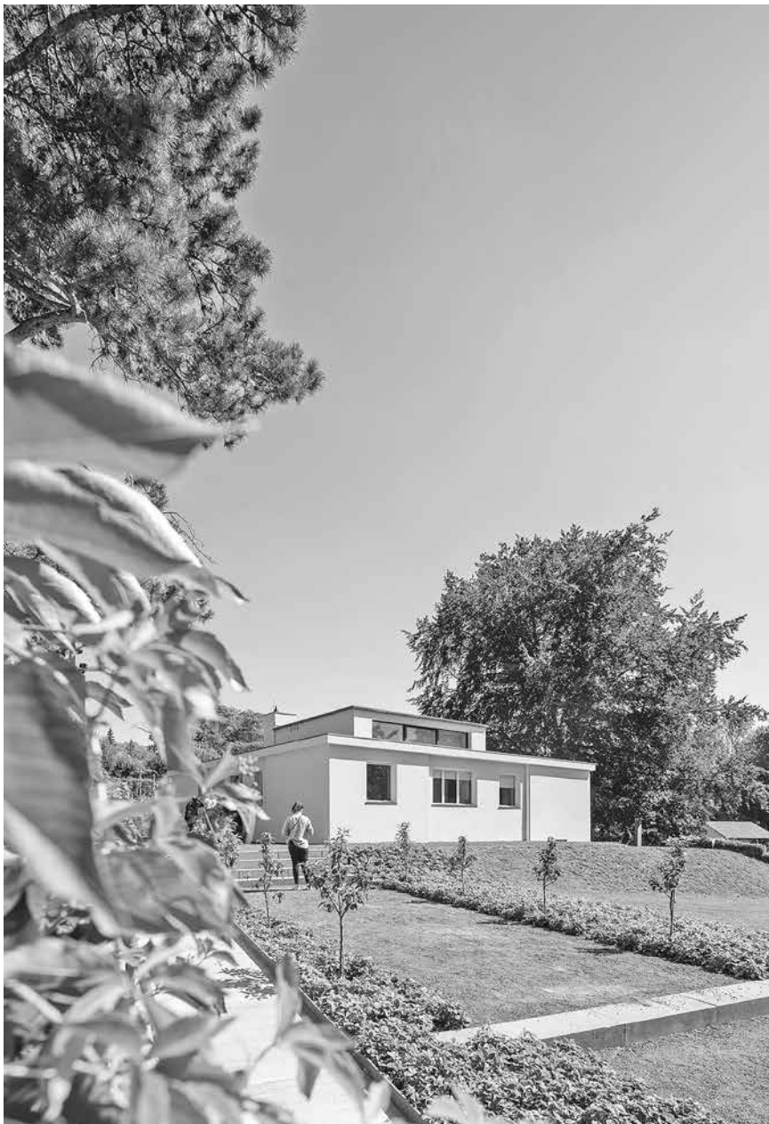
Das Haus Am Horn wurde für die Bauhaus-Ausstellung vor 100 Jahren eigens errichtet