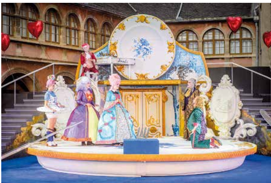
Così fan tutte