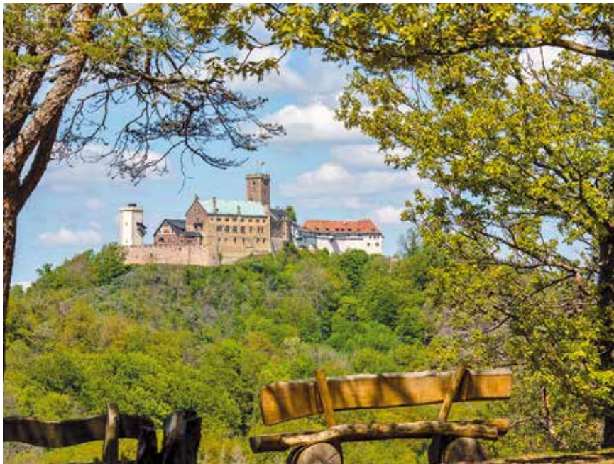
Blick vom Breitengscheid auf die Wartburg