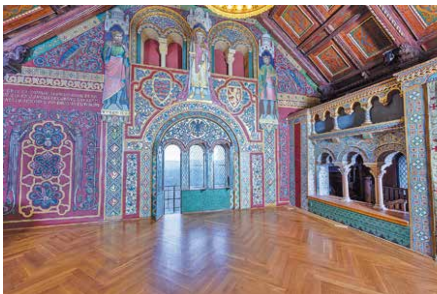
Blick auf die südliche Giebelwand des Festsaals im Palas der Wartburg

Besuchen Sie die „ideale Burg“ auch als einzigartigen Veranstaltungsort. Unser Konzertprogramm finden Sie unter www.wartburg.de