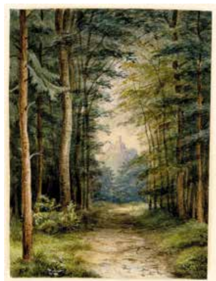
Blick auf die Wartburg von Süden Hans Anton Williard, um 1860, Aquarell Foto: Wartburg-Stiftung, Kunstsammlung, Inv.-Nr. G0380

Dabei stehen jedoch auch zentrale Fragen des gegenwärtigen und zukünftigen Weges der Wartburg im Blickpunkt: Welche Erlebnisse erwarten die Gäste in der Zukunft von ihrem Besuch? Wie kann Wissen um die Kultur und Geschichte des UNESCO-Welterbes attraktiv und zeitgemäß vermittelt werden? Wie können Anliegen des Tourismus, der Ökologie, der Nachhaltigkeit, des Klimaschutzes und des wirtschaftlichen Betriebes sinnvoll vereint werden? Und last but not least: Welche Voraussetzungen benötigt die Wartburg dafür? Die Wartburg-Stiftung möchte die Zukunft der Burg gemeinsam mit ihren Besucherinnen und Besuchern gestalten und lädt diese ein, über die Zukunft des Welterbes nachzudenken. Die zehnte Frage der Ausstellung richtet sich deshalb gezielt an ihre Besucherinnen und Besucher und fragt: Wie soll sie aussehen, die „ideale“ Wartburg des 21. Jahrhunderts?