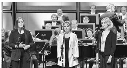
Begleitet von einem Orchester der Thüringen Philharmonie Gotha-Eisenach sangen drei Schülerinnen der Kreismusikschule Louis Spohr die „Ode an die Freude“.