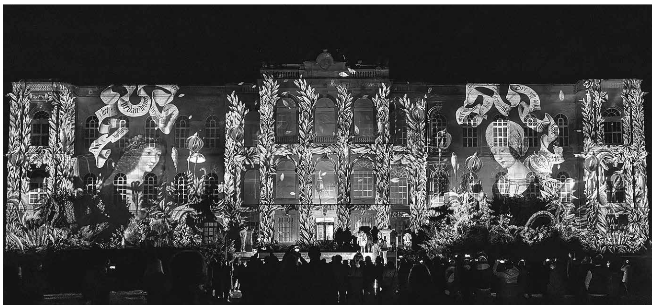
Besonders die audiovisuelle Projektion auf das Herzogliche Museum hat die Besucher:innen zur Illumination im Park verzaubert. An der Fassade zu sehen: das Gothaer Liebespaar.