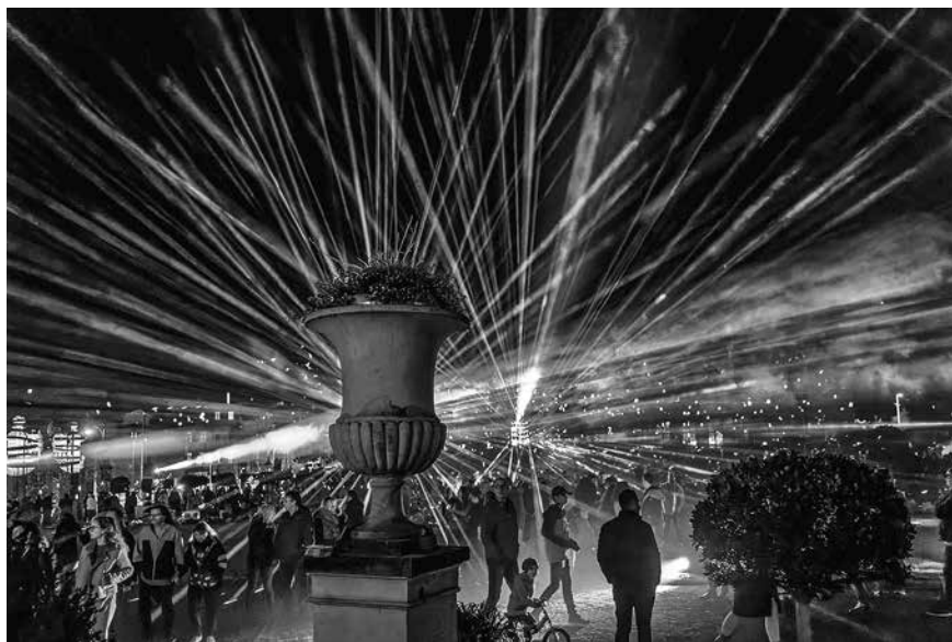
Durch die Lichtinstallationen an der Orangerie hatte man das Gefühl, in eine andere Welt einzutauchen.