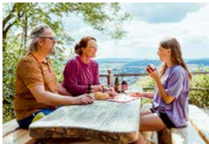
Picknick am TOP-Wanderweg Dün Panorama

Neben dem mehrfach ausgezeichneten Qualitätsweg NATURPARKWEG LEINEWERRA und dem das historische Eichsfeld umrundenden EICHSFELDWANDERWEG sind es vor allem die in den vergangenen Jahren zertifizierten Rundwanderwege, die durch besondere Attraktivität hervorstechen: