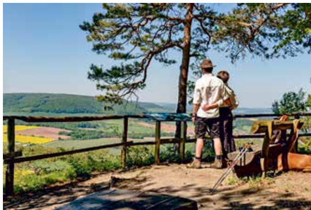
Aussichtspunkt an der Maienwand im Heiligenstädter Stadtwald, 437 m NN