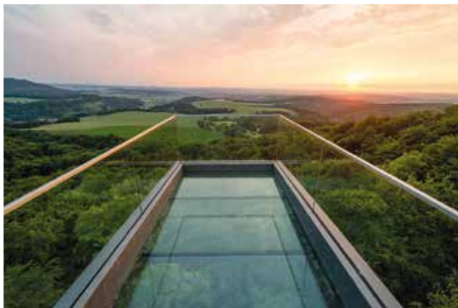
Der beeindruckende Skywalk Sonnenstein bietet eine herrliche Aussicht auf den Harz, das Ohmgebirge und die Goldene Mark