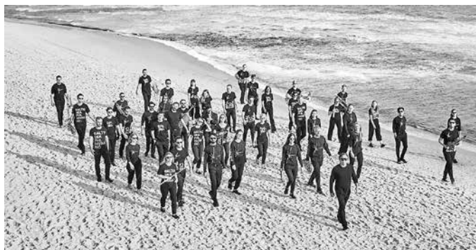
Baltic Sea Philharmonics

Verfasser: Ralf-Peter Fuchs, Superintendent Ev.-Luth. Kirchenkreis Eisenach-Gerstungen