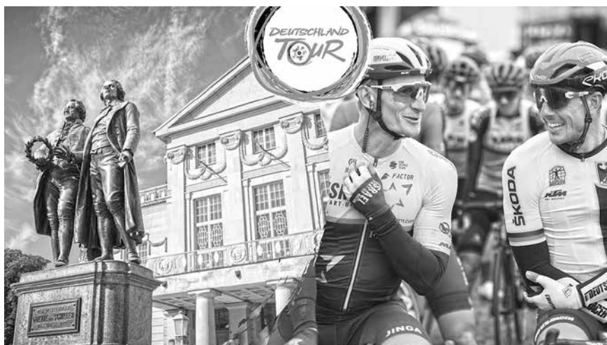
Die Deutschland Tour führt von Weimar nach Meiningen bis nach Marburg, anschließend von Freiburg nach Schauinsland und von Schiltach nach Stuttgart