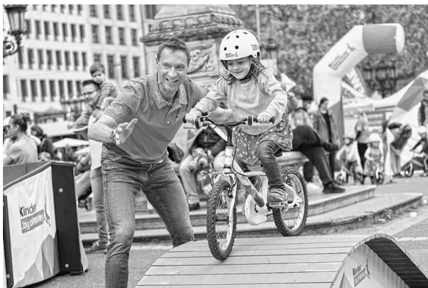
Bike Parade und Laufradrennen sind die Highlights für die Kleinsten