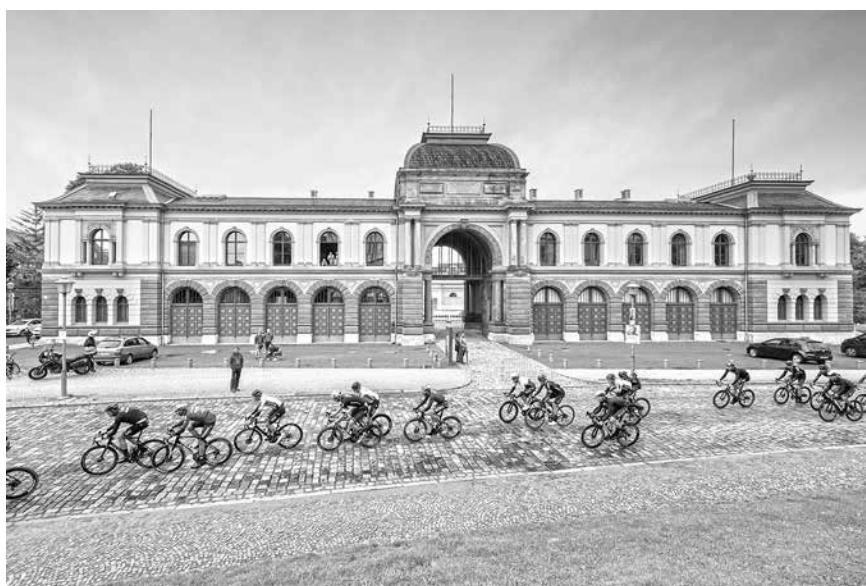
Durchfahrtsort 2021: Bereits im vergangenen Jahr war Weimar Schauplatz für die Deutschland Tour

Seit Monaten bereits laufen die Vorbereitungen für das Event in Weimar. Die Tour soll vor allem