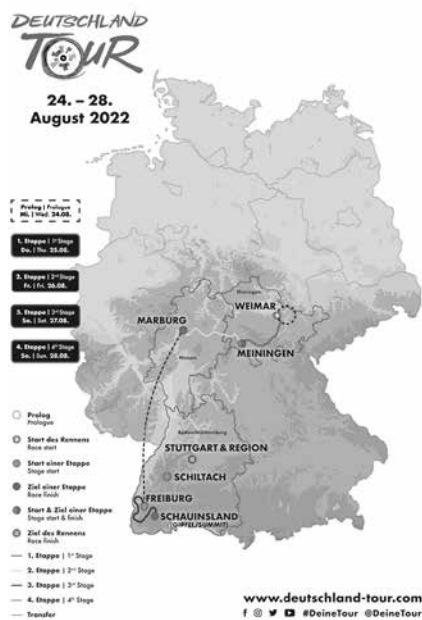
Die Strecke führt die Radrennprofis von Weimar über Meiningen nach Stuttgart Grafik: Gesellschaft zur Förderung des Radsports mbH

den Spaß am sportlichen Wettkampf und den Radsport als solches fördern. Dafür sind im Hintergrund zahlreiche Akteure in der Stadt an der Organisation beteiligt. Mitarbeiterinnen und Mitarbeiter der Stadtverwaltung, der Polizei, der Feuerwehr, des Stadtmarketings, ehrenamtliche Helferinnen und Helfer sowie die Organisatorinnen und Organisatoren der Deutschlandtour arbeiten Hand in Hand, damit der Ablauf am großen Tag auch reibungslos gelingt.