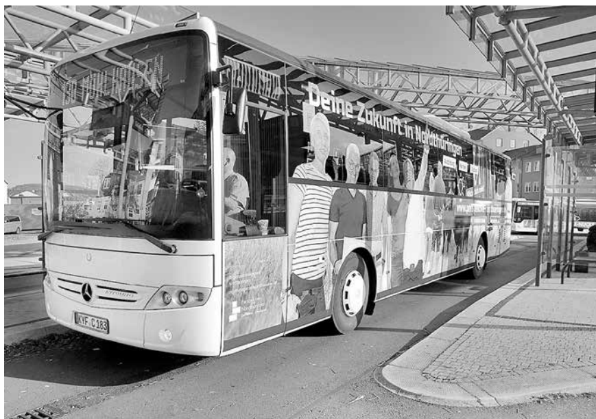
Der auffällig gestaltete Bus im Design des Regionalmanagements Nordthüringen verkehrt mehrmals täglich in der Region