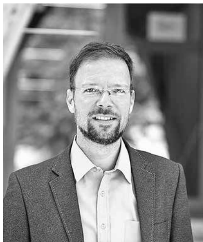
Oberbürgermeister Dr. Thomas Nitzsche

Es reicht aus, den Mangel kurz zu beschreiben, ihn einer Kategorie zuzuordnen und anzugeben, wo er sich befindet. Den Ort kann der Nutzer entweder auf einer Karte händisch eintragen oder via GPS lokalisieren lassen. Zusätzlich gibt es die Option, ein Bild des Mangels hochzuladen. Wer darüber informiert werden will, wenn sich der Status des Eintrags ändert oder für Rückfragen zur Verfügung stehen will, kann seine E-Mail-Adresse angeben.