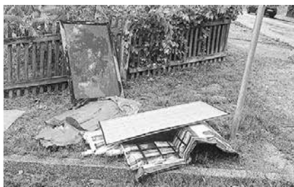
Müllecken gehören zu den häufigeren Mängeln