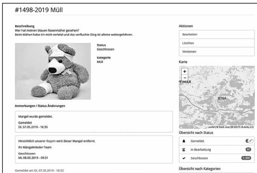
Ungewöhnlicher Mangel: Teddy sucht Rasenmäher

Da es sich bei diesem Eintrag allerdings um eine Suchmeldung und damit nicht um einen Mangel im Sinne des Mängelmelders handelt, konnte der Eintrag nicht freigegeben werden. Denn die Regeln gelten natürlich für alle Nutzer – selbst für plüschige Zeitgenossen.