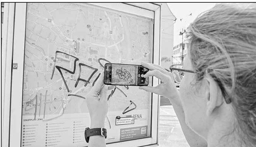
Mängel melden ganz einfach: Bild hochladen und Ort ergänzen