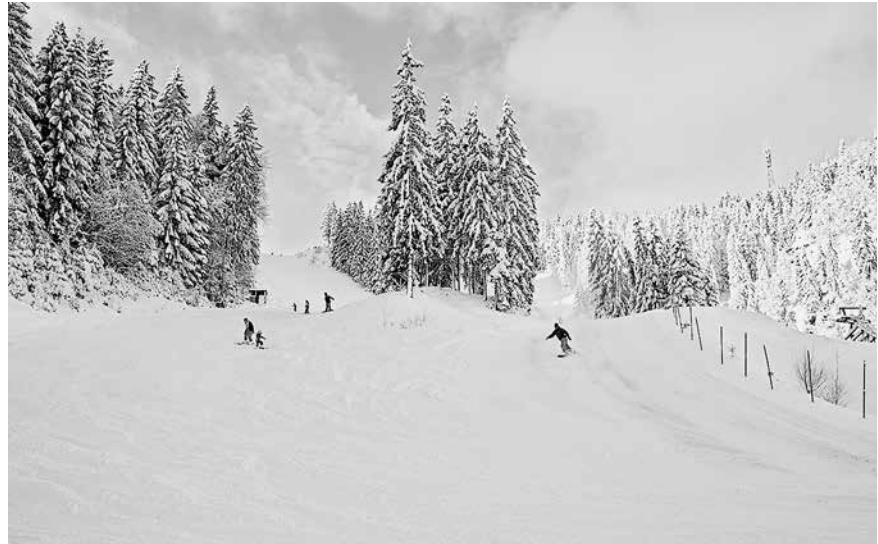
Das 12. Landkreisfest am Rennsteig findet passender Weise unweit des Kammwegs in Steinach statt – denn am Steinacher Fellberg liegt mit der Skiarena Silbersattel Thüringens größtes und schneesicherstes alpines Skigebiet