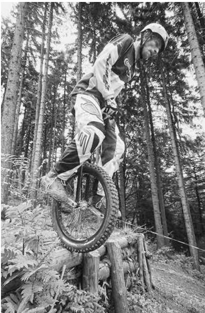
Im Sinne des Ganzjahreskonzepts wird die Skiarena Silbersattel im Frühjahr und Sommer unter anderem zur Bikearena

Erreichbar sind die Stadt Steinach und das Festgelände übrigens bequem mit der Süd-Thüringen-Bahn. Darüber hinaus stehen im Stadtgebiet