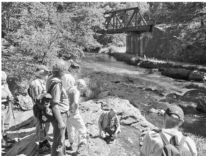
Auf Tour-Natur im Steinicht, einem steilwandigen Flusstal der Weißen Elster im thüringischen und sächsischen Vogtland