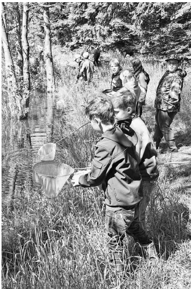
Schulkinder entdecken den Pöllwitzer Wald, eines der größten zusammenhängenden Waldgebiete der Region