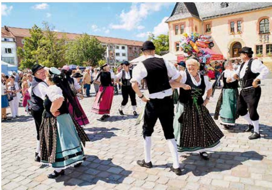
Auch viele Vereine, wie hier die Trachtentanzgruppe des Heimatvereins Wenigensömmern bei einem Auftritt zum Stadtfest, bringen sich ins Thüringentag-Programm mit ein – sei es mit einem Informationsstand, beim großen Festumzug oder auch beim Bühnenprogramm