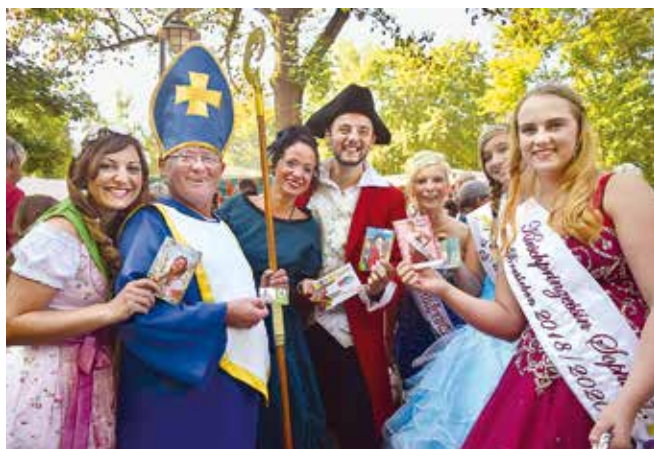
Beim Bauernmarkt in Sömmerda waren die Hoheiten und das Thüringentag-Paar ein beliebtes Fotomotiv

Unterstützt wird der Thüringentag 2019 in Sömmerda von der Sparkasse Mittelthüringen, der Sömmerdaer Energieversorgung GmbH sowie zahlreichen weiteren Sponsoren und Kooperationspartnern.