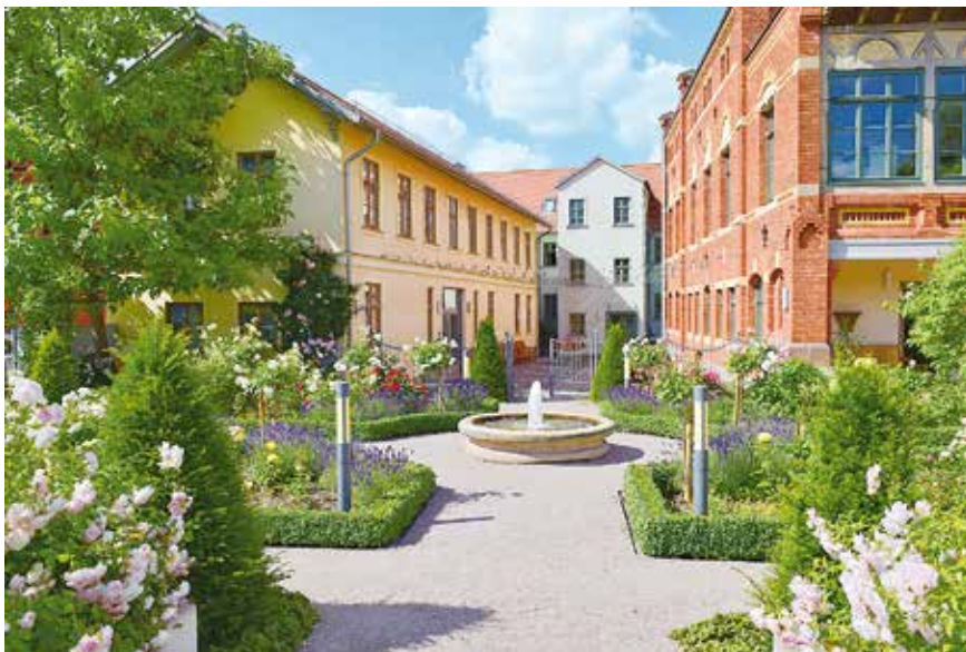
In den Sommermonaten finden im Rosengarten am Dreyse-Haus regelmäßig Konzerte, veranstaltet von der Stadt- und Kreisbibliothek und ihrem Förderverein, statt. Der Rosengarten, bepflanzt mit etwa 160 Rosenstöcken nach historischem Vorbild, ist zudem ein idealer Platz für die ein oder andere Museunde am Thüringentag-Wochenende.