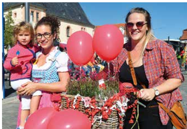
Mit vielen verschiedenen Motiven präsentiert sich der jährliche Ernteumzug der Stadt