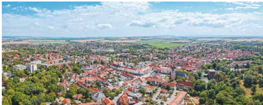
Sömmerda mit seiner Altstadt verwandelt sich zum Thüringentag in ein großes Festgelände