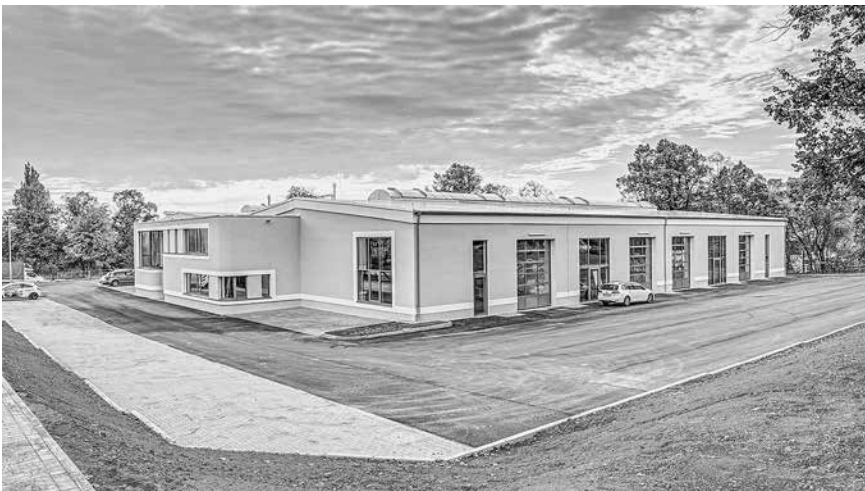
Der neue Standort in der Ernst-Thälmann-Straße