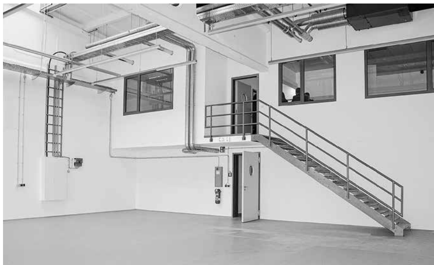
Noch freie Produktionshalle am neuen Standort