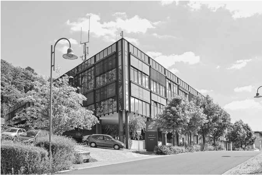
Gründer- und Innovationszentrum am Standort in Stedtfeld