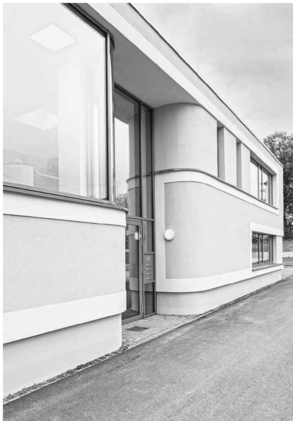
Architektonisches Detail am neuen Anbau

Außerdem wurde im neuen Eingangsgebäude ein Aufzug montiert; so ist auch das Obergeschoss künftig barrierefrei erreichbar. Zur Verfügung stehen jetzt auch zwei größere Besprechungsräume, die von allen Mietern genutzt werden können.