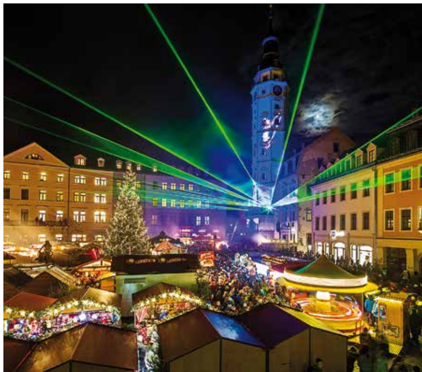
Zur Eröffnung am 29. November werden zahlreiche Besucher erwartet. Mit einer Licht-Laser-Show wird unter anderem ein Märchen erzählt.

kalender für die großen und kleinen Geraer herzustellen. Das diesjährige Hauptmärchen „Die Goldene Gans“ zielt die Vorderseite des Kalenders. Im Hintergrund ist eine Stadtsilhouette mit dem Theater, der Salvatorkirche, dem Stadtmuseum und weiteren Sehenswür-