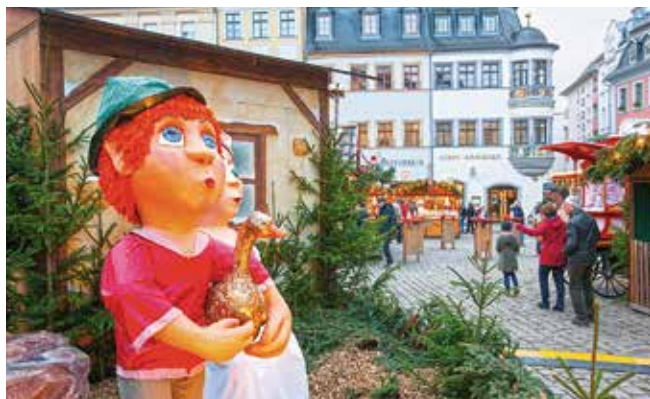
Seit 2017 bereichern neue Figuren den Märchenmarkt, unter anderem vom diesjährigen Hauptmärchen „Die Goldene Gans“