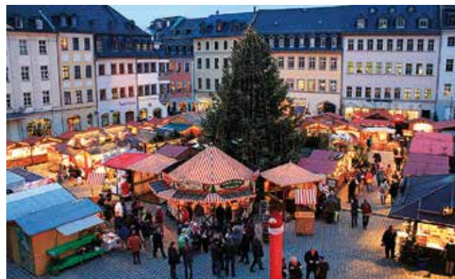
Der Rathausurm bietet einen wundervollen Blick auf den Märchenmarkt