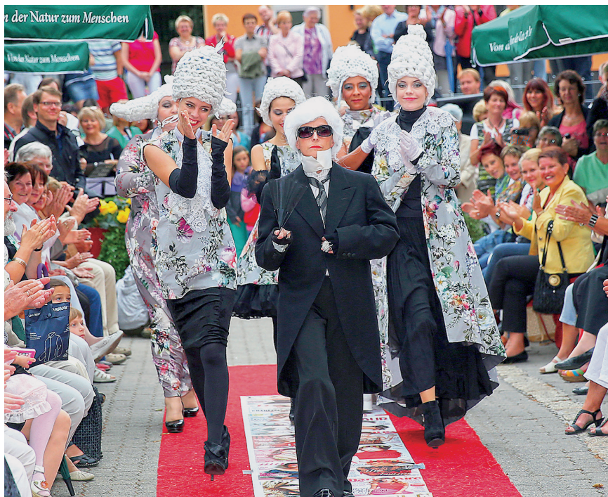
Stauen, staunen und nochmals staunen – das kann man zur 14. Schleizer Modenacht am 25. August 2018