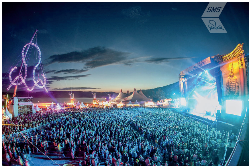
Das SonneMondSterne-Festival lockt jedes Jahr tausende Jugendliche an den größten Stausee Deutschlands, nach Saalburg – zum Tanzen und Feiern