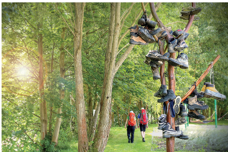
Der 168 Kilometer lange Rennsteig, der fränkisch-thüringische Höhenwanderweg, beginnt bzw. endet in Blankenstein im Saale-Orla-Kreis