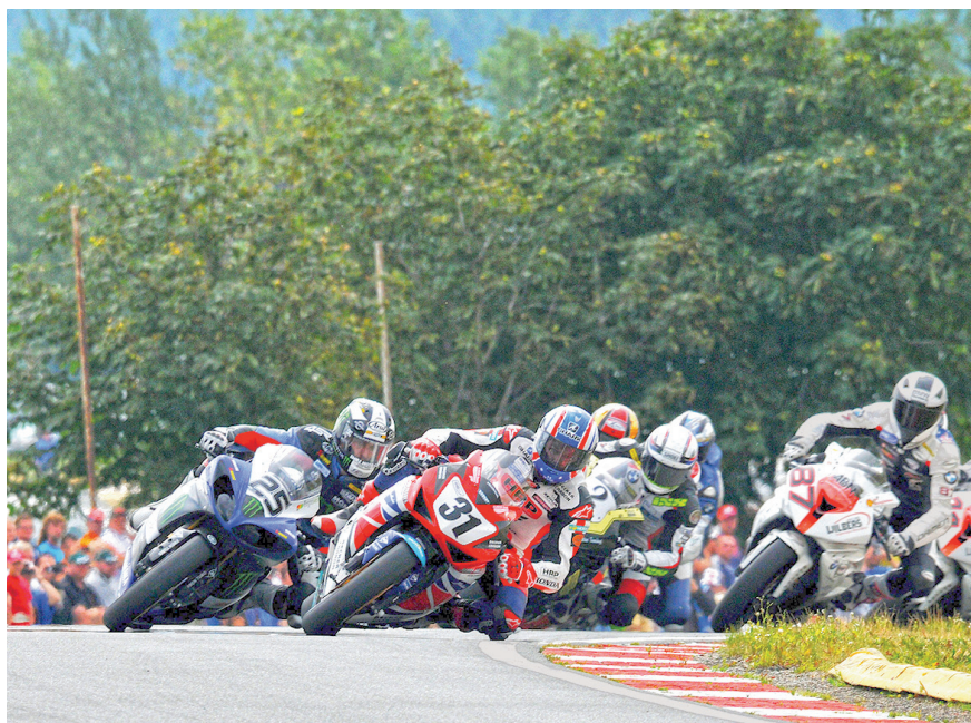
Motorsport live erleben – darauf freuen sich die Teilnehmer und Fans der diesjährigen Rennen auf dem Schleizer Dreieck, der ältesten Naturrennstrecke Deutschlands