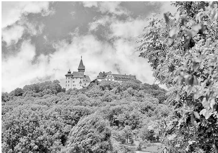
Blick auf die Veste Heldburg

... das Jubiläums-Fest. Am 10. Juni 2018 gibt der Landkreis Hildburghausen auf dem Parkplatz des Landratsamtes und der davorliegenden, abgesperrten Wiesenstraße, den besonderen regionalen Anbietern im Bereich Handwerk, Kultur, Unterhaltung, Tradition, Vereine, Gesundheit und Kulinarisches die Möglichkeit, sich zu präsentieren und den Landkreis zu repräsentieren.