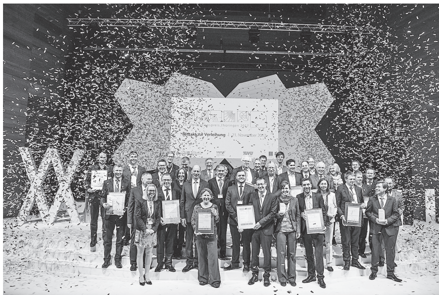
Die glücklichen Preisträgerinnen und Preisträger des Innovationspreiswettbewerbes Thüringen 2017