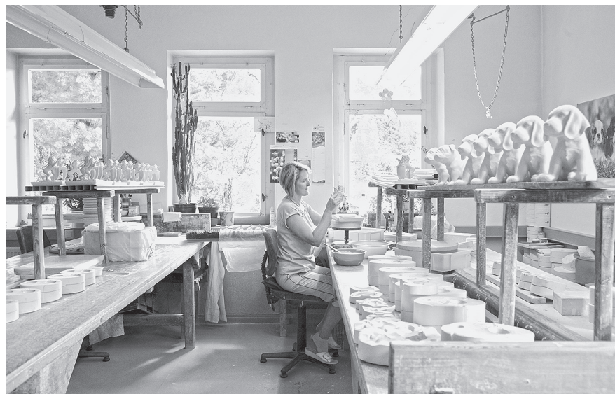
Porzellanherstellung bei der Wagner & Apel GmbH Porzellanfiguren Lippelsdorf

Die Thüringer Tischkultur präsentiert auch verschiedene Veranstaltungen in der Region. Sowohl der „Tag des Thüringer Porzellans“ als auch der berühmte „Bürgerler Töpfermarkt“ bieten viele Tischkultur-Highlights und lassen regionales Handwerksgut wieder im neuen Glanz erscheinen. Jährlich im Herbst findet der