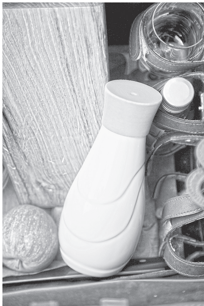
Unsere Tavolina – ein Herzstück der Thüringer Tischkultur

von Saale und Unstrut, frisch gepresste Säfte von unseren Streuobstwiesen, Wild aus heimischen Wäldern, Gemüse und Wurstspezialitäten vom Direktvermarkter.