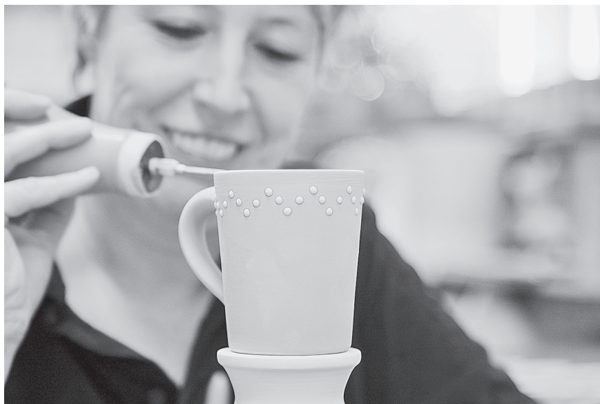
Den Töpfern bei Echbürgel beim Malhörnchen-Setzen über die Schulter schauen