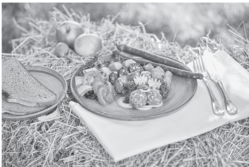
Typisch Thüringisch genießen