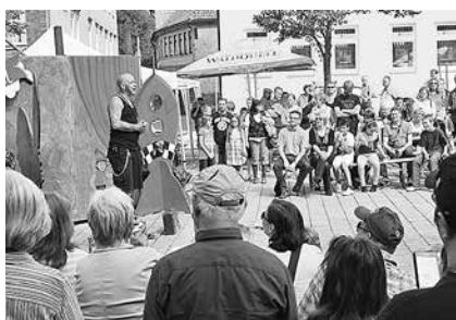
Das Publikum geht mit in Suhl. So soll es auch bei den Angeboten 2017 wieder sein.

Doch am besten, Interessenten machen sich selbst ein Bild von der Vielfalt der Kultur auf den Straßen und Plätzen von Suhl. Das Ziel dieses Festivals ist es schließlich, das Publikum aus dem Alltag zu entreißen und Menschen verschiedenster Couleur nebeneinander über ein und dieselbe Sache Freude empfinden zu lassen. Doch soll es auch eine Stadt zusammenschweißen, Zukunftsvisionen ermöglichen und ein Image erschaffen: Als Vorbild für viele, die sich etwas trauen. Für eine Welt voller Kreativität und Zuversicht. Herzlich willkommen zum Kulturfest für Jung und Alt, dem 4. Suhler StraßenTheaterFestival.