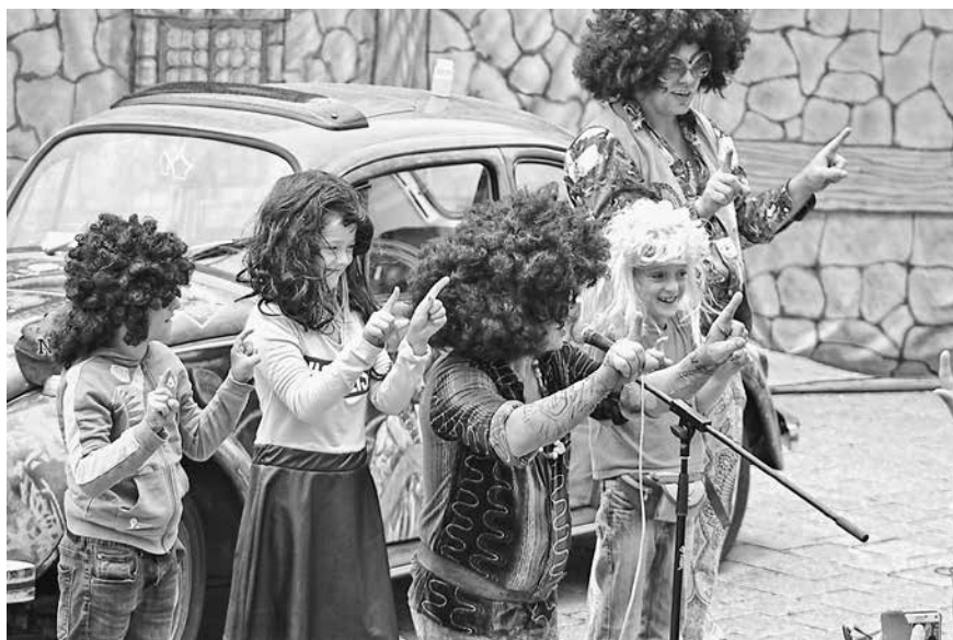
Aktionen für und mit Kindern und den Zuschauern gehören zu jedem der Suhler StraßenTheaterFestivals