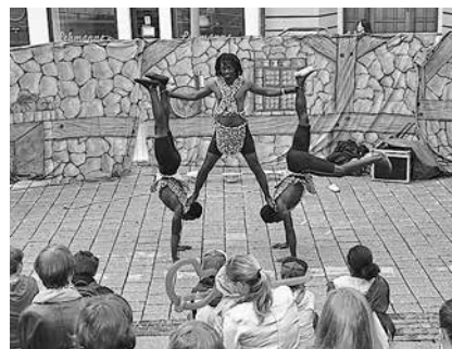
Straßentheater auf der „Bühne“ im Steinweg

Manch ein Gast wird seinen Lieblingsakteur gern auch ein zweites Mal erleben wollen. Und dass Kinder sowieso einbezogen werden, das kennt man in Suhl aus den Vorjahren schon.