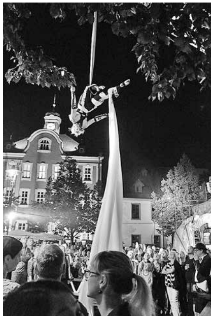
Spektakuläre Artistik gab es zum 3. Suhler StraßenTheaterFestival zu sehen

lich bester Sonntagslaune. Dann nämlich öffnen ab 13:00 Uhr in der Innenstadt auch die Läden anlässlich des StraßenTheaterFestivals. Wer mag, kann neben den kulturellen Aktionen auch noch einkaufen gehen oder einfach durch die Geschäfte flanieren. Dabei kommen die Interessen der Kulturmacher und des Stadtmarketingvereins e. V. zusammen. In Suhl hat man bisher gute Erfahrungen mit solch einer Verknüpfung gemacht. Wieder ist viel los auf den Spiel- und Erlebnisflächen in der Stadt.