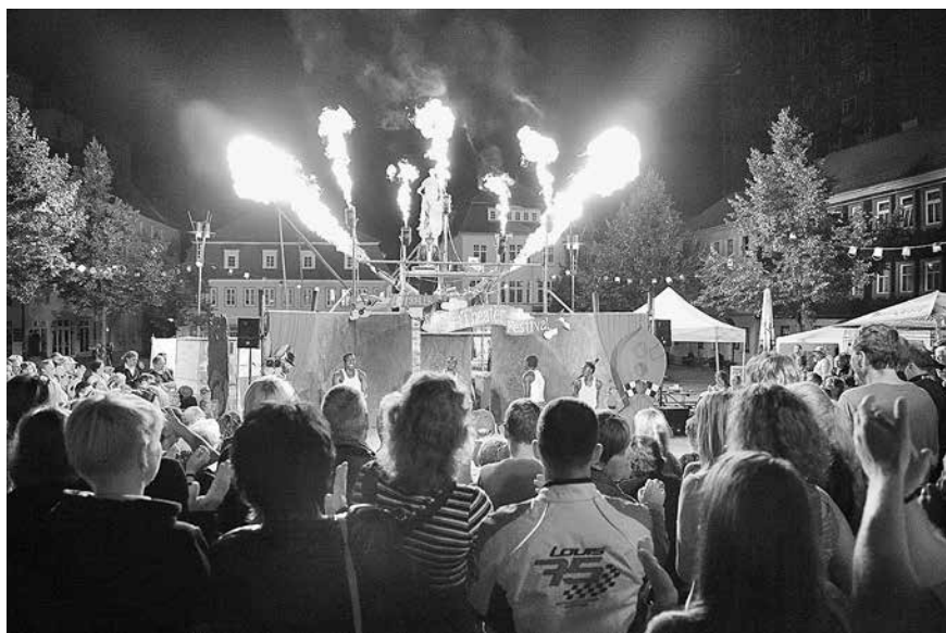
Großes Finale des StraßenTheaterFestivals