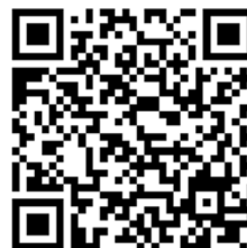
QR-Code zum Tourenportal JenaSaaleland

Weitere Informationen zum Tourenportal, zur App oder zum Saaleland sowie zur Thüringer Tischkultur gibt es über das ServiceCenter Saaleland unter Tel. 036601 905200, E-Mail: info@saaleland.de oder online www.saaleland.de und www.thueringer-tischkultur.de .