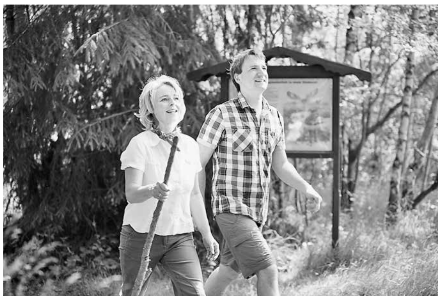
Wanderer im Eisenberger Mühlthal