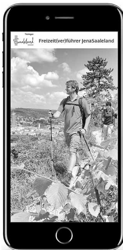
Startbildschirm der App