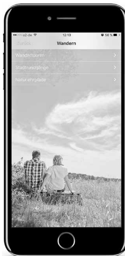
Menü-Führung der App