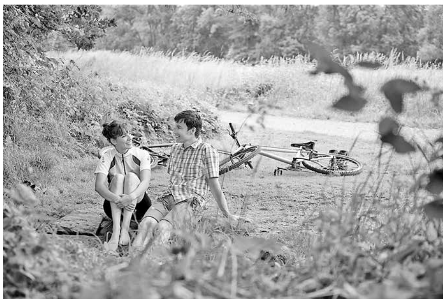
Radfahrer Rast im Grünen