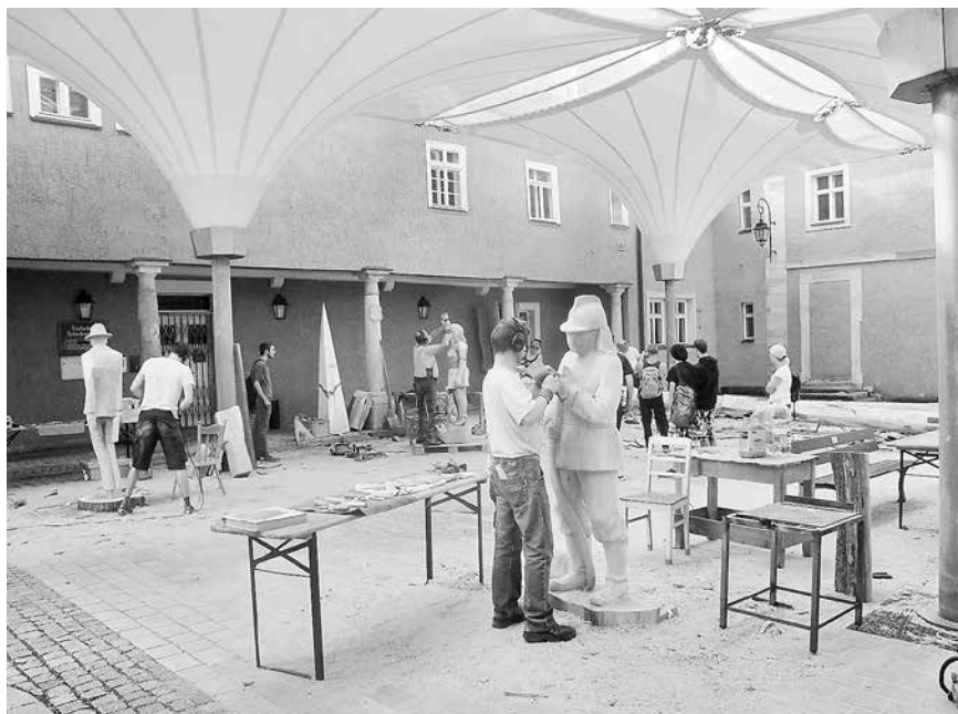
Der Steinacher Schlosshof mit seiner raffinierten Dachkonstruktion bietet Bildhuern wie Gästen eine wunderbare Kulisse für Kreativität und Begegnung

siert wird. Am Montag, dem 17. Juli, gibt es die offizielle Eröffnung. Am Samstag, dem 22. Juli, zeigen die Bildhauer nachmittags nochmals publikumswirksam ihr Können beim Speedcarving, bevor am Abend eine Party mit Live-Musik steigt. Am Sonntag, dem 23. Juli, wird wiederum zur Verabschiedung der Bildhauer ein abwechslungsreiches Programm mit zahlreichen Kreativangeboten für die ganze Familie gestaltet. Unter dem Titel „Schlosshofserenade“ übernimmt dabei der Musikverein Steinach e. V. die musikalische Unterhaltung. Bereichert wird die Serenade durch das Schirmtheater „Musenkuss“. Zudem lädt ein kleiner, aber feiner Kunsthandwerkermarkt zum sonntäglichen Bummeln rund um das Steinacher Schloss ein.