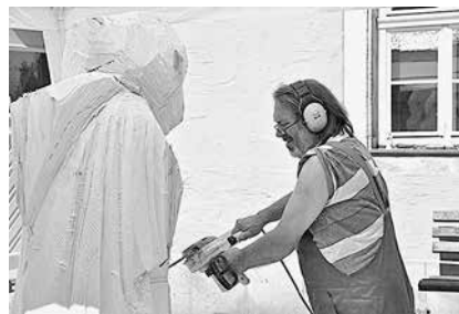
Impressionen zurückliegender Steinacher Bildhauersymposien. Die Künstler freuen sich auf interessierte Zuschauer und Gesprächspartner.