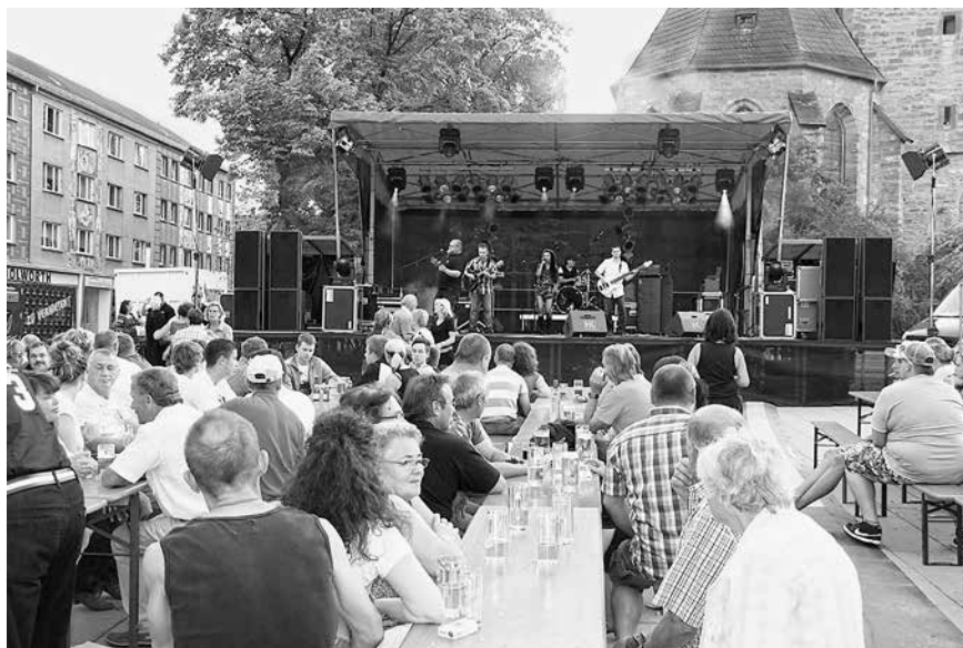
Freuen Sie sich auf ein abwechslungsreiches Kulturprogramm am 10. Juni 2017 in Sömmerda Archivfotos vom 2. Unstrut-Radwandertag 2011 in Sömmerda

Mit knapp 43 Kilometern ist diese Tour etwas für eingelebte Radtourfans. Vom Treffpunkt in der Kur- und Rosenstadt Bad Langensalza gelangen wir auf dem Unstrut-