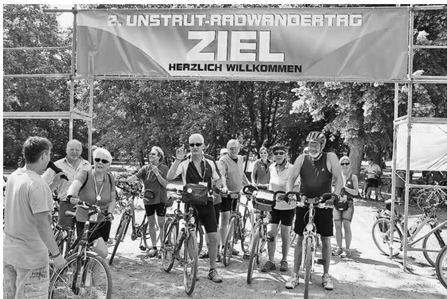
Sömmerda war bereits Ziel des 2. Unstrut-Radwandertages im Jahr 2011

Weitere Informationen finden Sie unter www.soemmerda.de und www.unstrutradweg.de