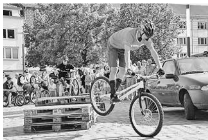
Fahrrad-Akrobaten sorgten 2011 in Sömmerda für Begeisterung