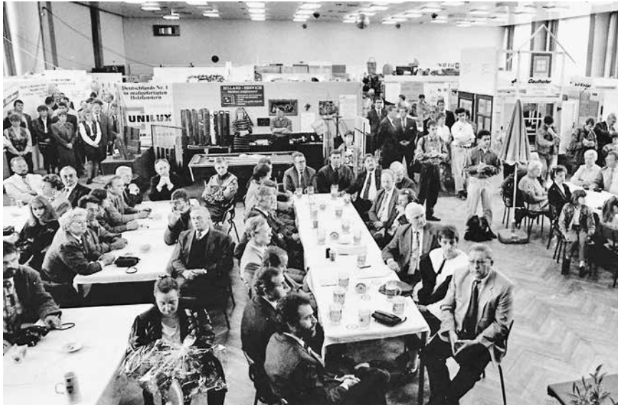
Eröffnungsveranstaltung der 1. Saale-Orla-Schau am 2. Oktober 1993 im ehemaligen Glashaus und dem angrenzenden Freigelände in Neustadt an der Orla