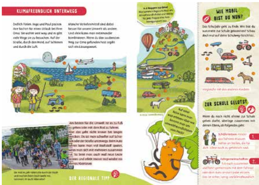
Themenseite „Klimafreundlich unterwegs“ aus dem 3. Möhrenheft zu Energie und Klima 2016