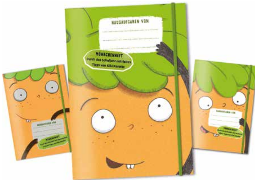
Titelseiten der Möhrenhefte 2014, 2015 und 2016 mit Kiki Karotte nachhaltig durchs Schuljahr