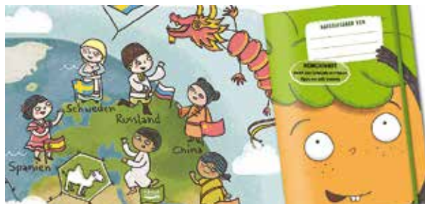
Collage aus Möhrchenheft 2015 Eine Welt für Alle

Ein herausnehmbarer, großer Ernte-Kalender kann zu Hause aufgehängt werden und zeigt, wann regionales Obst und Gemüse erhältlich ist bzw. selbst geerntet werden kann. So können die Kinder immer selbst nachsehen, in welchem Monat Radieschen, Erdbeeren oder Birnen bei uns reif werden und wie lange sie gelagert werden können. Diese Breite und didaktische Aufbereitung bietet die Chance, über die Kinder, hineingetragen ins Elternhaus und das Lebensumfeld weitere Multiplikatorinnen und Multiplikatoren mit diesen wichtigen Themen zu erreichen. Im Rahmen der Thüringer Nachhaltigkeitsstrategie unterstützen die Schulämter Mittel-, Nord- und Ostthüringen das nachhaltige Hausaufgabenheft.