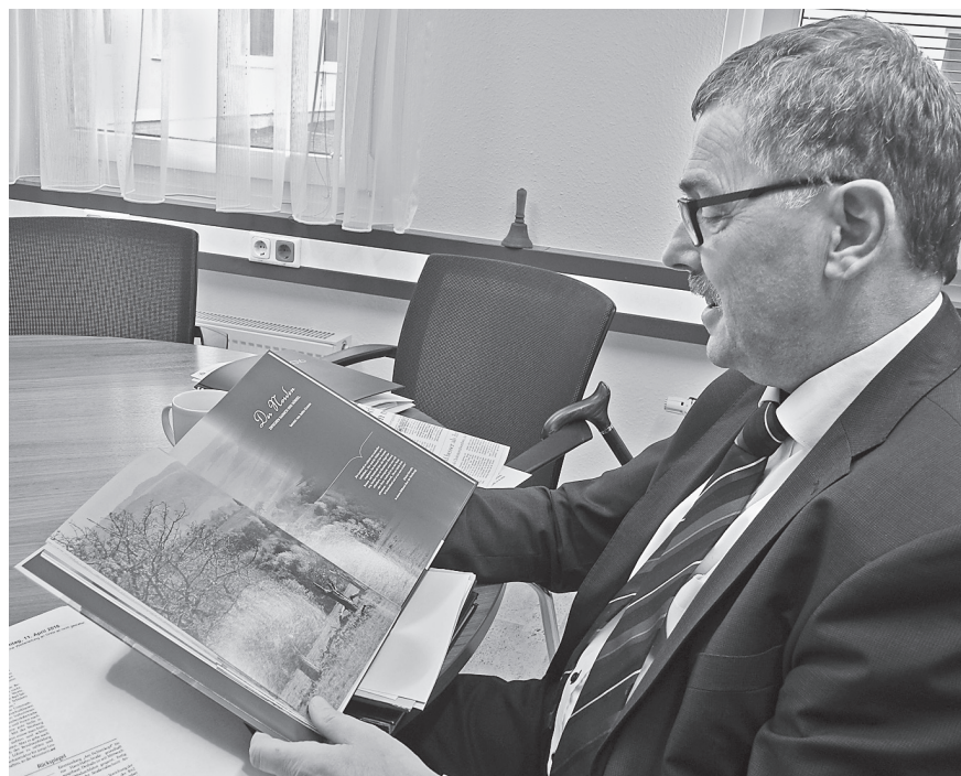
Landrat Reinhard Krebs blättert begeistert im neuen Buch.