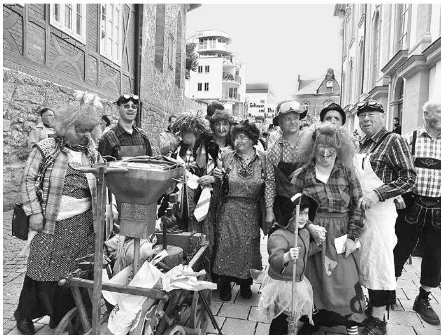
Das Hexenteam beim vorigen Wettbewerb um den Thüringer Bratwurstkönig in Suhl

Am 4. Juni entern kleine Piraten die Stadt – Krönung des Thüringer Bratwurstkönigs am 5. Juni