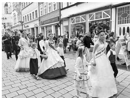
Umzug der Hoheiten durch den Suhler Steinweg beim Wettkampf um den Thüringer Bratwurstkönig 2014

Am Sonntag, dem 5. Juni 2016, ab 13:00 Uhr, wird auf dem Suhler Marktplatz dann der 6. Thüringer Bratwurstkönig gesucht und nach einem hoffentlich wieder spannenden Bratwurstbrat-Wettbewerb gekrönt. Aktuell ist Gerhard Herbst aus