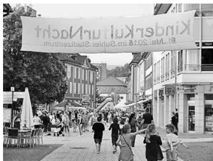
Den Kindern gehört die Stadt, wie hier im Vorjahr, zur Kinder-Kultur-Nacht in Suhl