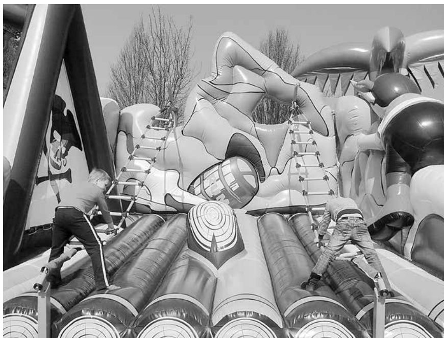
Eine der Attraktionen zur Kinder-Kultur-Nacht in Suhl am 4. Juni 2016: Eine Pirateninsel mit Klettermöglichkeiten für die Kinder