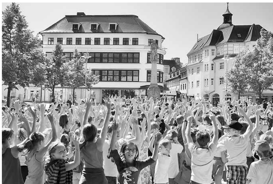
So viele begeisterte Kinder wie hier zum Kindertag im Vorjahr auf dem Suhler Marktplatz soll es auch zur 11. Kinder-Kultur-Nacht wieder geben