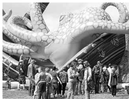
Eine der Attraktionen zur Kinder-Kultur-Nacht in Suhl am 4. Juni 2016: Ein Piratenschiff, das gerade ein Krake entert – und Kinder sich eben noch rutschend ins Freie retten können