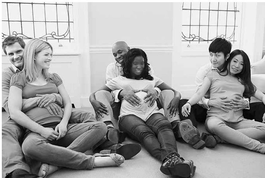
Für werdende Eltern gibt es eine Vielzahl an regionalen Angeboten, die den Start ins Leben erleichtern und bereichern