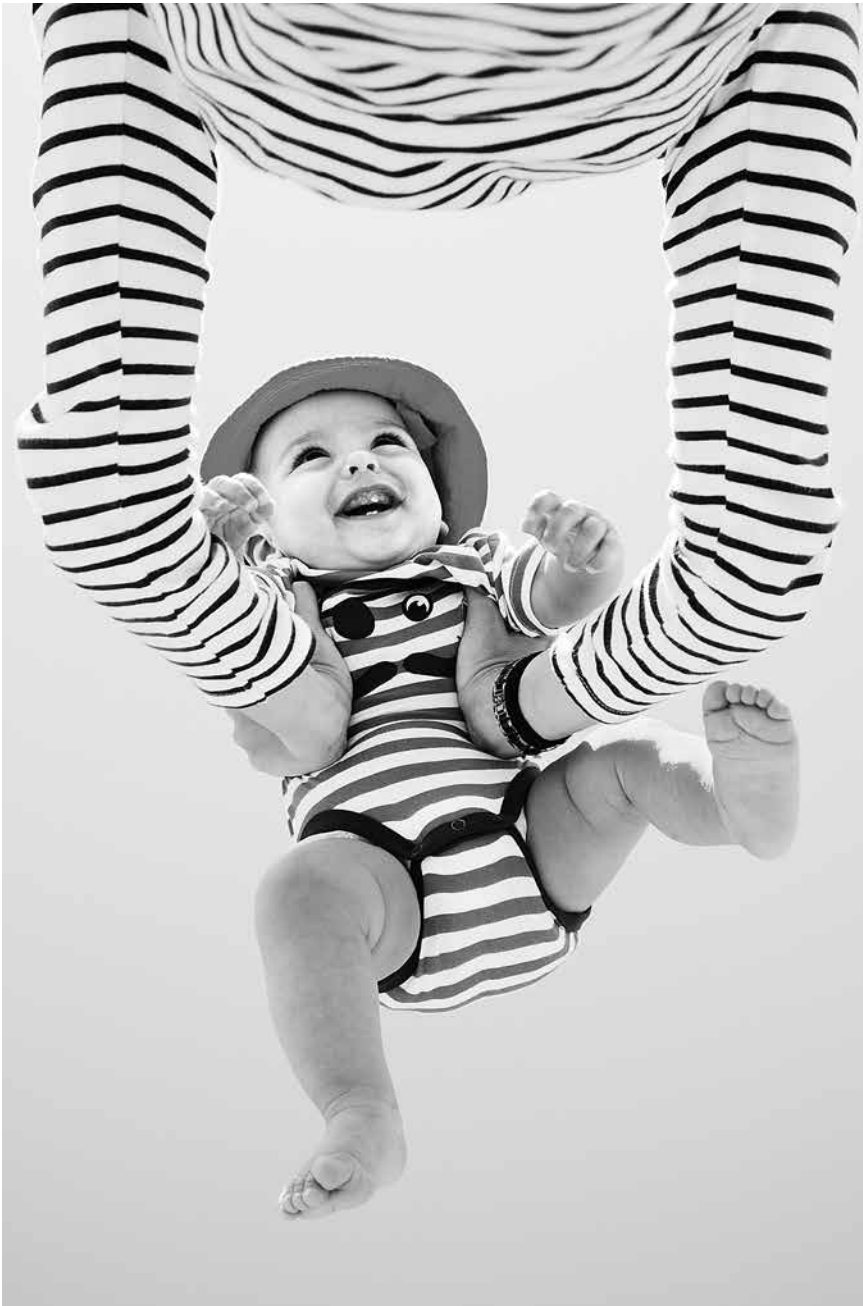
Die Entwicklung der Kinder frühzeitig fördern