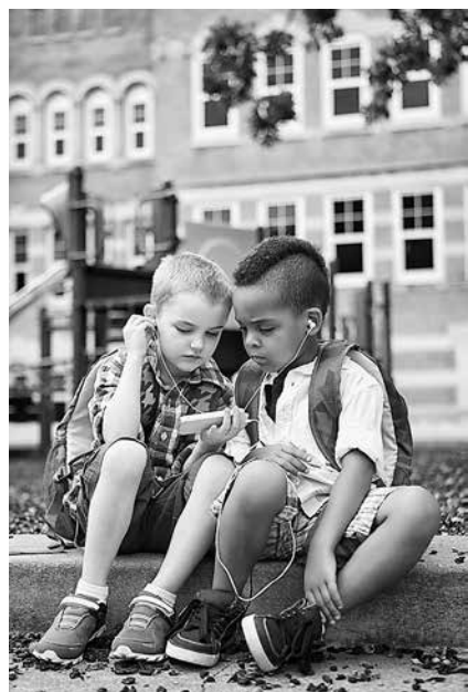
Das Webportal www.familienprofis-thueringen.de bietet hilfreiche Informationen für Familien mit Kindern im Vorschulalter

sowie Ämtern und Behörden wollen damit eine hohe Transparenz der lokalen Angebote im Kontext Früher Hilfen sichern und nicht zuletzt die Weiterentwicklung der sozialen Infrastruktur und der Angebote im Landkreis Sömmerda für alle Familien und für spezifische Zielgruppen fördern.