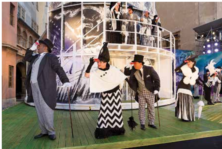
„My Fair Lady“ 2014