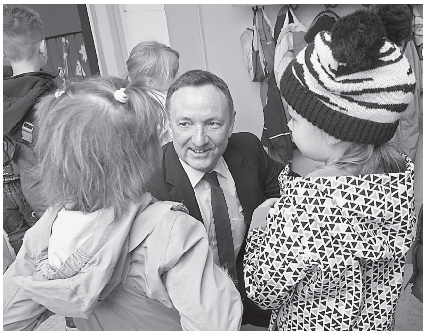
Nachdem der Minister den Kindern vorgelesen hatte, ging es erst einmal raus an die frische Luft zum Spielen