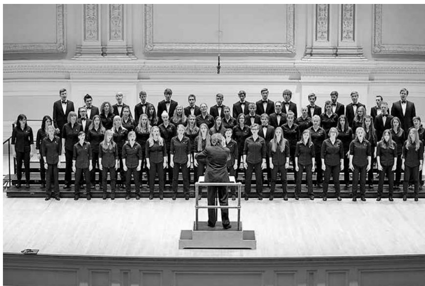
Der Konzertchor des Goethe-Gymnasiums/Rutheneum seit 1608 bekam die erste Auszeichnung als Botschafter der Stadt Gera