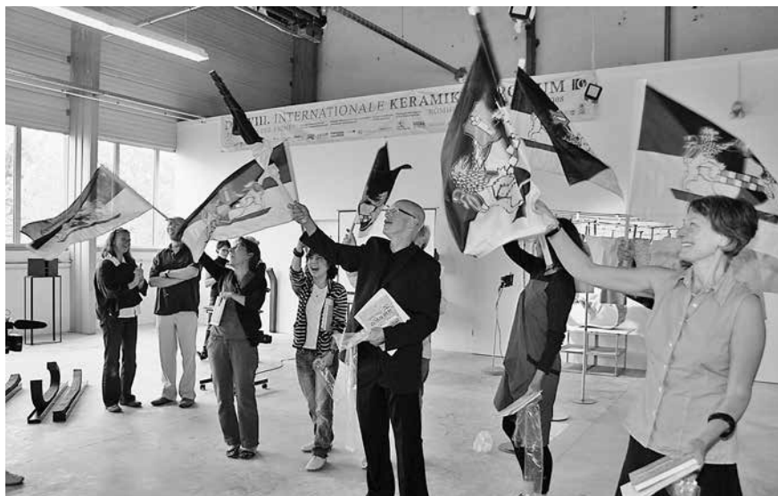
Die Symposiumsteilnehmer 2011 nehmen Abschied von Römhild